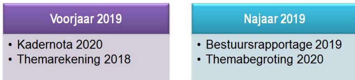
Figuur 2: Voorbeeld van behandeling rapportages in 2019

Om te verduidelijken hoe de beleids- en begrotingscyclus van verschillende boekjaren in een kalenderjaar door elkaar heen lopen is hieronder een voorbeeld weergegeven welke rapportages er in 2019 behandeld worden.