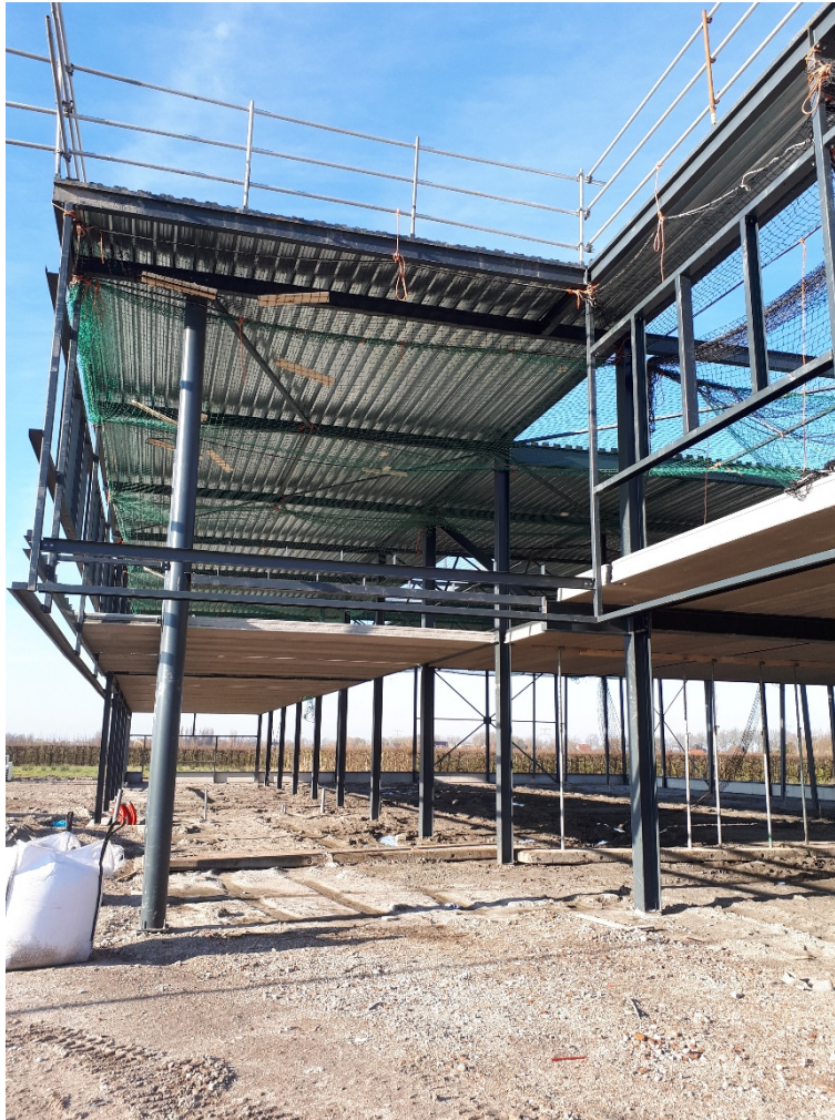
Figuur: Bouwen volgens omgevingsvergunning