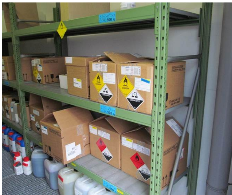
Figuur: gevaarlijke stoffen

In de matrix Toezicht en Handhaving behorende bij het onderliggende uitvoeringsplan staan de taken en projecten genoemd die door de RUD NHN worden uitgevoerd voor zover die rechtstreeks betrekking hebben op activiteiten, doelgroepen of inrichtingen. Daarnaast voert de RUD NHN een aantal ondersteunende taken uit op het gebied van ketentoezicht, informatie gestuurd handhaven, milieuvluchten en een 24-uurs bereikbaarheid voor calamiteiten en klachten.