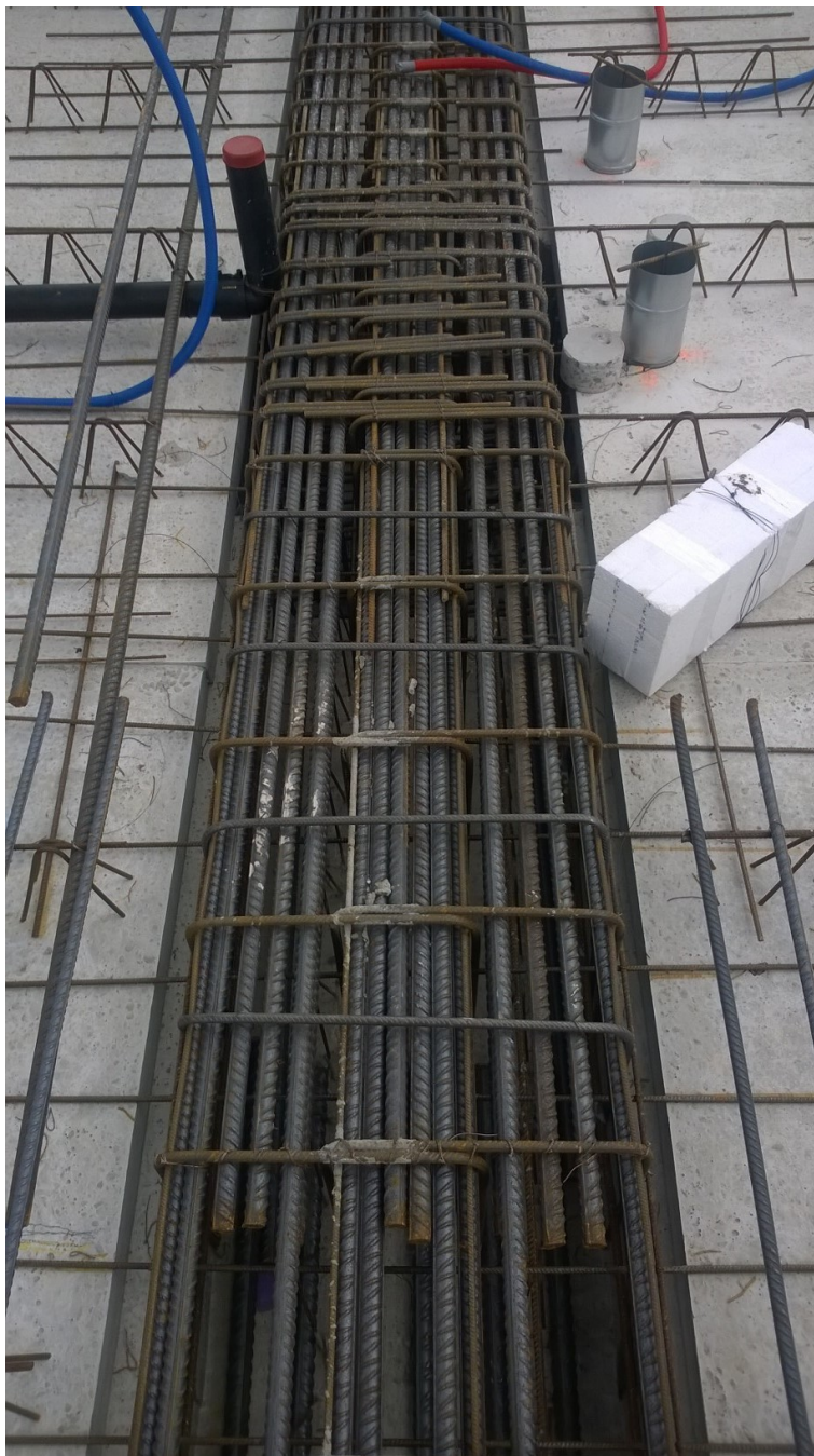
Figuur: betonstorten wordt lastig