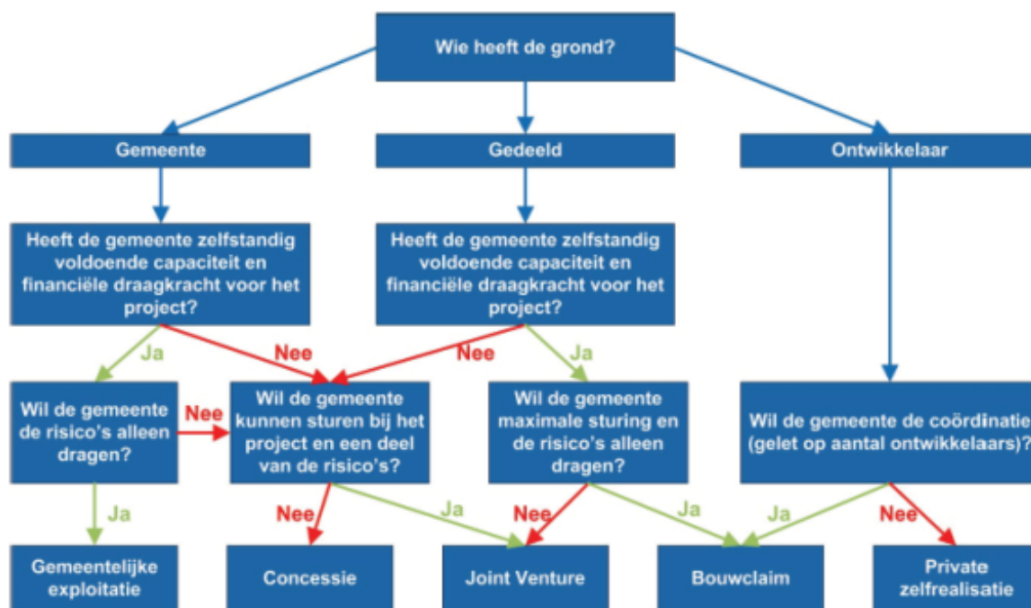
Figuur 2 Stroomschema ontwikkelstrategie

In figuur 2 "Stroomschema ontwikkelstrategie" is een stroomschema opgenomen dat de gemeente kan helpen bij het maken van keuzes omtrent de te volgen ontwikkelstrategie. Hieruit komen mogelijke keuzes naar voren voor samenwerkingsvormen en projectontwikkeling.