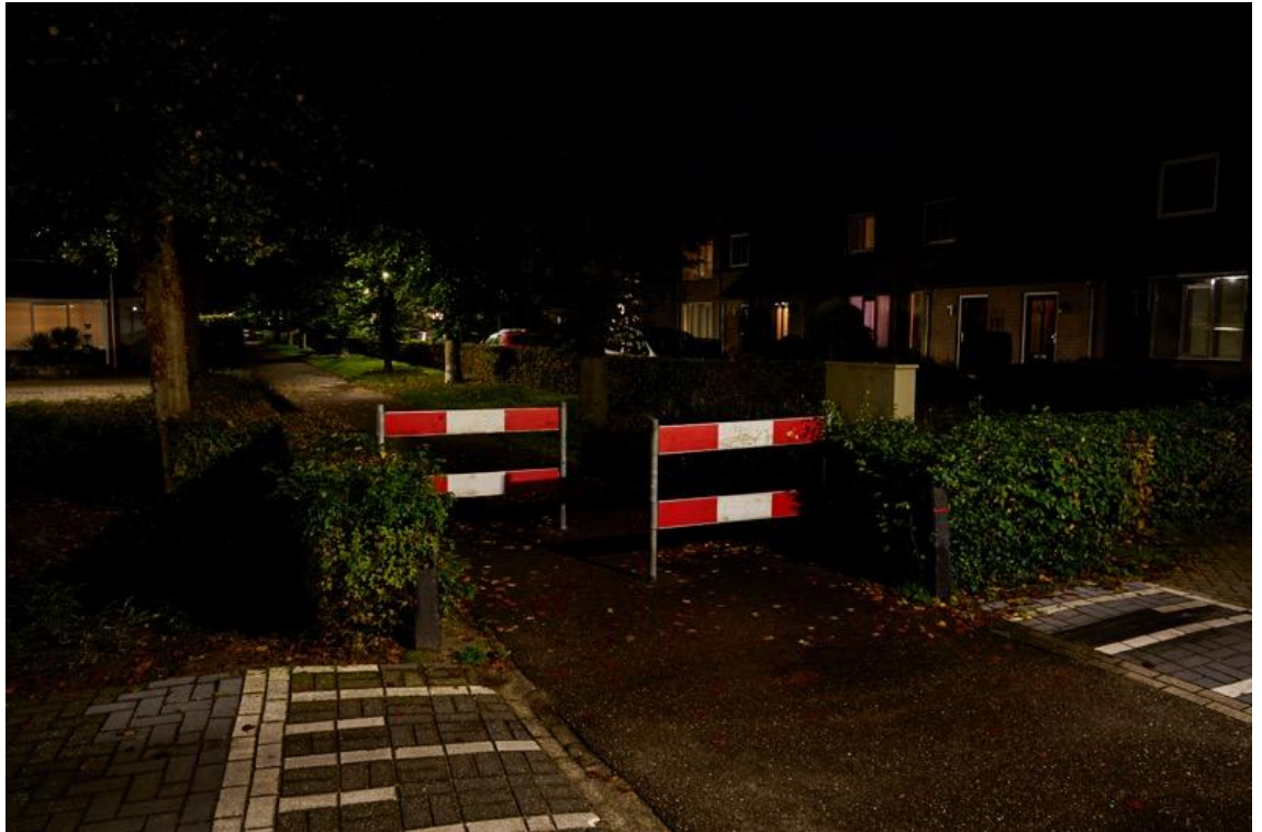
Foto: Lieshout Brugstraat; schrikhekjes geven goed weer waar een obstakel of bocht is.