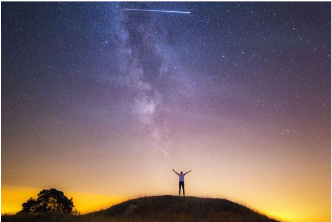
Foto: Door alle lichtvervuiling is de sterrenhemel niet meer te zien.

Voor wat betreft de openbare verlichting zetten we nog meer in op een lagere lampsterkte, gericht licht (minder strooilicht) en na de spits wordt overal gedimd zodra dit technisch mogelijk is. Het dimregime wordt afgestemd per locatie.