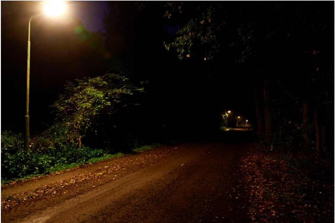
Foto: Lieshout fietspad Stiphoutseweg. Het licht geeft schijnveiligheid want er is geen sociale controle

De gemeente kiest in woon- en centrumgebieden een lichtkleur waarbij gezichten goed herkenbaar zijn, zoals bijvoorbeeld (warm) wit. Hier speelt de sociale veiligheid een belangrijke rol. Als de kleuren niet goed worden weergegeven, draagt dat niet bij aan de sociale veiligheid. Op onderstaande foto is goed het verschil in lichtkleur te zien: