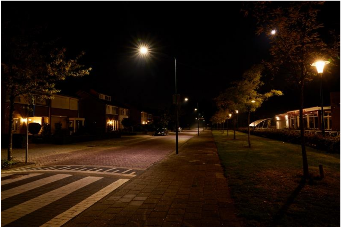
Foto: Beek en Donk Otterweg, nieuwe verlichting die gericht is op de weg en niet rondom schijnt.

Per gebied zal de gemeente bekijken welke hoeveelheid licht wenselijk is. Er komt bij vervanging in ieder geval niet méér licht op straat dan nu het geval is en er wordt gedimd zodra dit technisch mogelijk is. Kleur- en gezichtsherkenning zijn belangrijk.