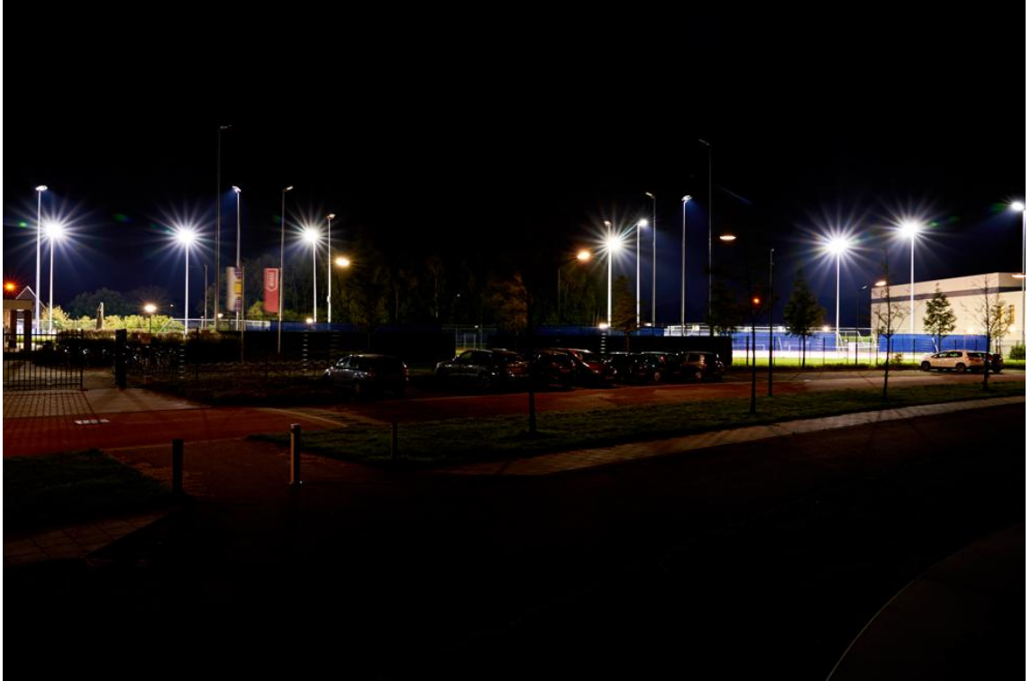
Foto: Tennispark 't slotje, Kerkackers in Beek en Donk. Met nieuwe gerichte ledverlichting op de tennisbanen wordt onnodige lichthinder voorkomen. Natuurlijk zie je het tennispark wel van veraf als het licht brandt.

Het meeste licht dat op de parkeerterreinen bij sportvelden staat, is van de gemeente zelf. Na 23.00 uur moet alle veldverlichting uit zijn, maar het licht op de parkeerterreinen is meestal de hele nacht nog aan, terwijl er geen auto meer staat. Dan kan het licht ook best uit toch?