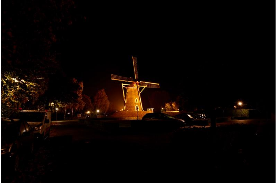
Foto: Lieshout Molenstraat, kerk aangelicht. Mooi in de avond als herkenningspunt, maar uit in de nacht.

We vinden dat deze verlichting na 22.30 uur uitgeschakeld moet worden. Ook dient de verlichting gericht te zijn en niet omhoog te stralen. Zo kunnen lichthinder en lichtvervuiling verminderd worden. Bestaande verlichting wordt de komende jaren (indien dit nodig is) vervangen en betreffende monument, kerk e.d. wordt dan op basis van bovenstaande verlicht.