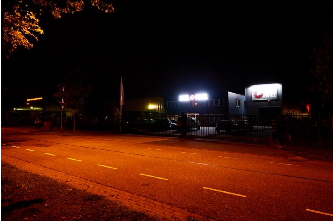
Foto: Lieshout bedrijventerrein De Stater; felle reclameborden die niet meer leesbaar zijn.

Of het licht op een parkeerterrein bij een bedrijf, deze blijft ook vaak branden.