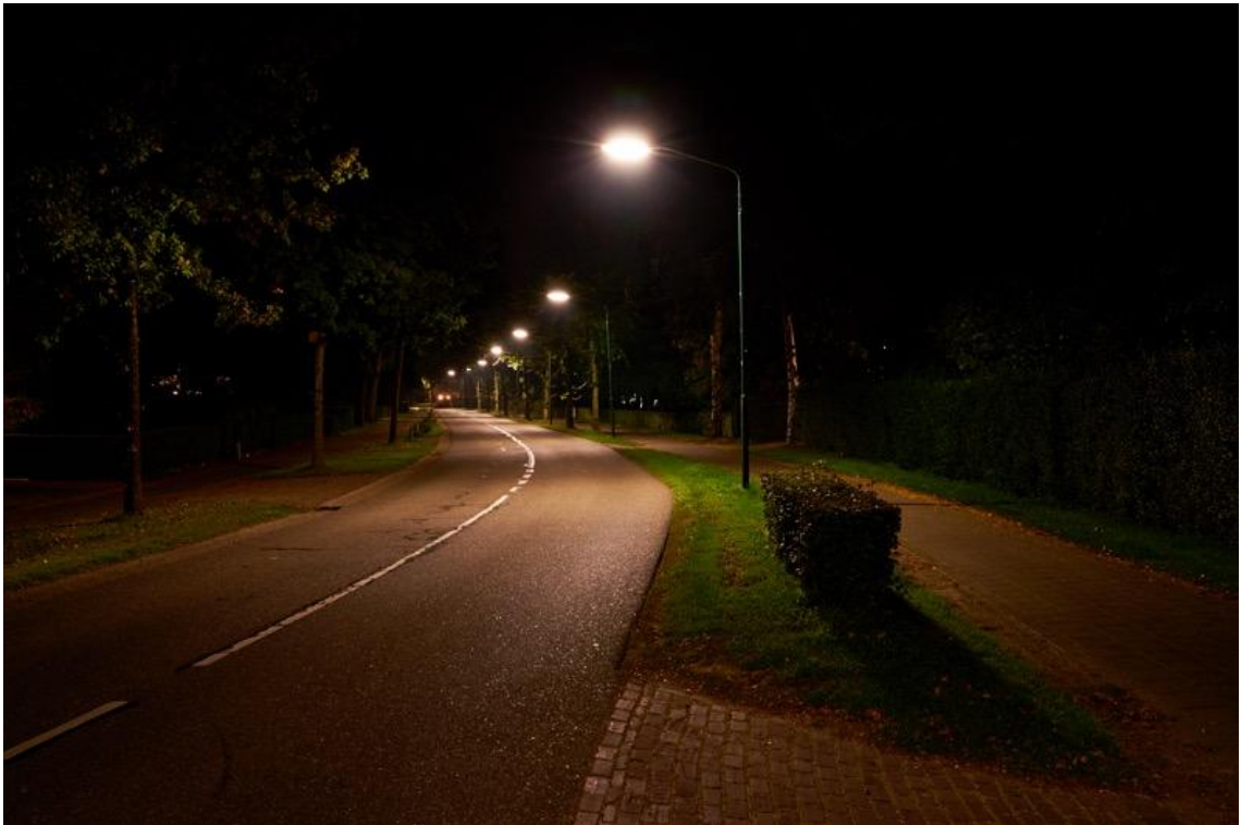
Aarle-Rixtel Helmondseweg, gebiedsontsluitingsweg