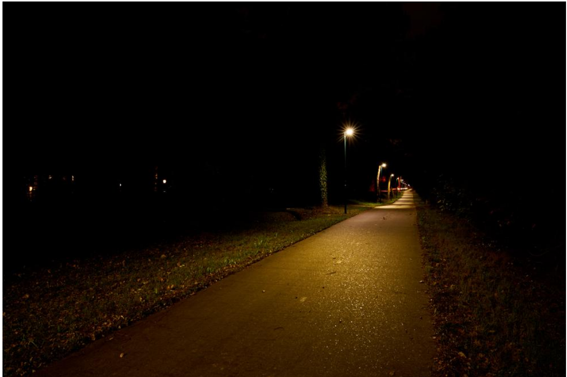
Foto: Molenheide in Lieshout, doorgaande fietsroute met verlichting.

De verlichting langs deze fietsverbindingen wordt gedimd of in de late avond/nacht uitgezet worden zodra dit technisch mogelijk is. Ook passen we op deze fietspaden sensoren toe, zodra dit technisch mogelijk is, waarmee het licht aan gaat als er van de weg gebruik gemaakt wordt.