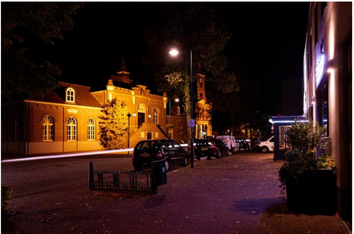
Foto: Aarle-Rixtel; oude gemeentehuis en winkelpand in de nacht verlicht.

We vinden dat deze verlichting na 22.30 uur uitgeschakeld moet worden. Ook dient de verlichting gericht te zijn en niet omhoog te stralen. Zo kunnen lichthinder en lichtvervuiling verminderd worden. Bestaande verlichting wordt de komende jaren (indien dit nodig is) vervangen en betreffende monument, kerk e.d. wordt dan op basis van bovenstaande verlicht.