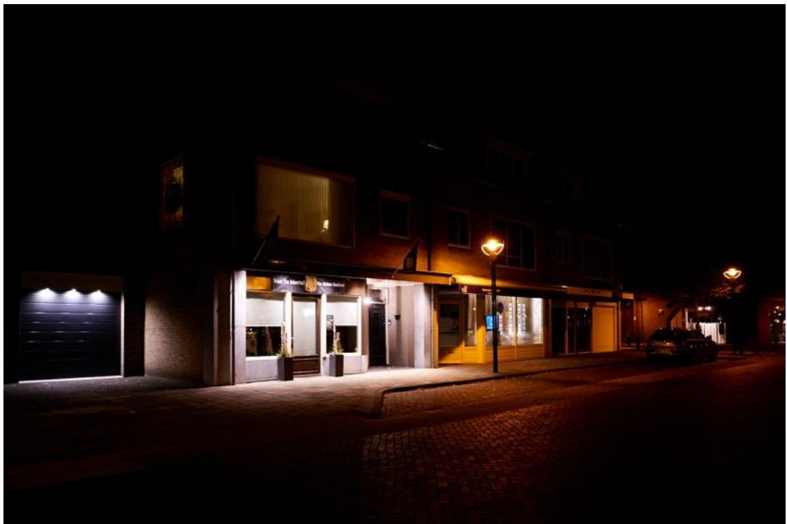
Foto: Beek en Donk Heuvelplein, verlichte winkel

Op de parkeerterreinen is het licht in de avond gedimd en waar mogelijk gaat het in de nacht uit. Verlichte reclame staan we niet toe. Verlichte reclame mag alleen voorkomen op/aan het perceel van het bedrijf of waar de activiteit plaatsvindt. In principe staan we knipperende lichtreclames en leddisplays niet toe.