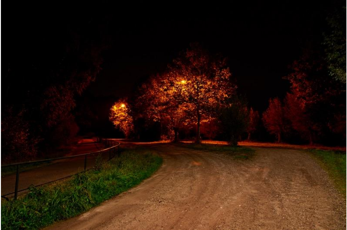
Foto: Lieshout Provinciale weg, vrachtwagen parkeerplaats. Geen sociale controle, dus geeft licht schijnveiligheid

Belangrijk is om te kijken na welk tijdstip nog gebruikt gemaakt wordt van de parkeerterreinen. De gemeente verlicht parkeerterreinen die in de avond niet veel gebruikt worden na 22.30 uur, of zoveel eerder als mogelijk, niet meer.