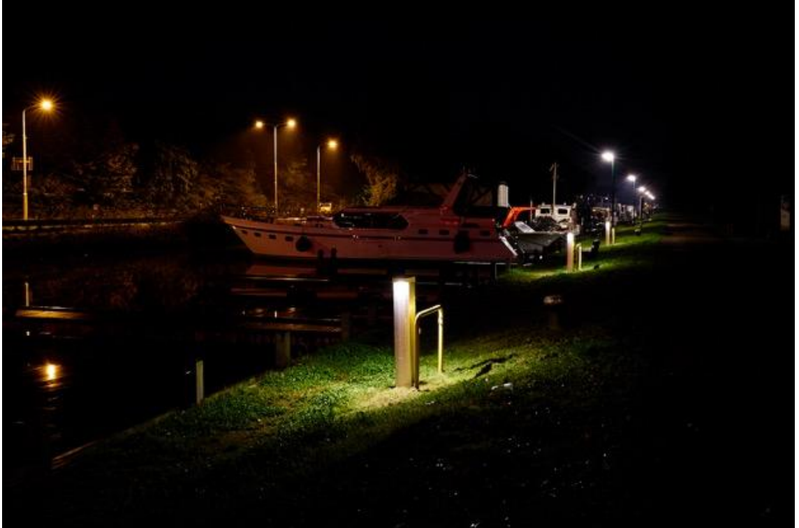
Foto: Aarle-Rixtel Havenweg passantenhaven. 's-Zomers licht in de avond, maar buiten het toeristen-seizoen kan deze verlichting uit.