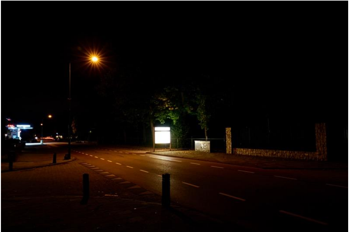
Foto: Mariahout Mariastraat plattegrondkast

passen zodat het licht in de nacht uit gaat. Mocht dit tussentijds niets mogelijk zijn, dan wordt het in het nieuwe contract opgenomen.