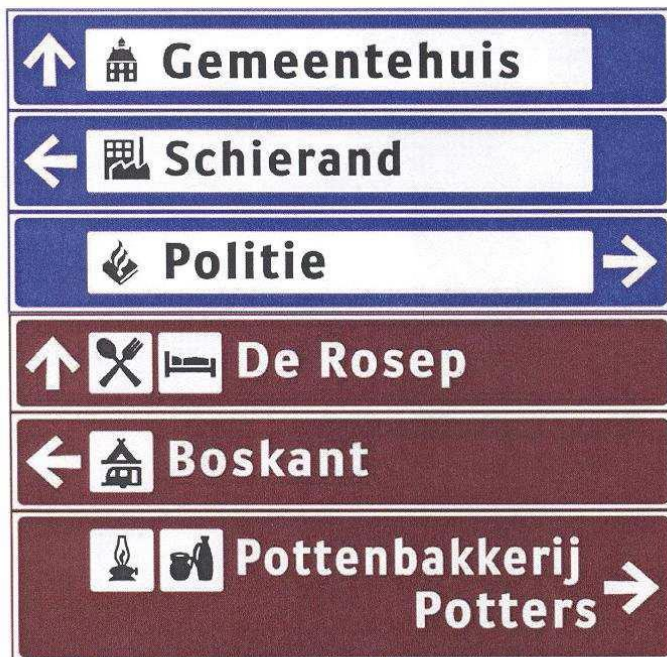
Figuur 9: Voorbeeld van gecombineerde objectbewegwijzing