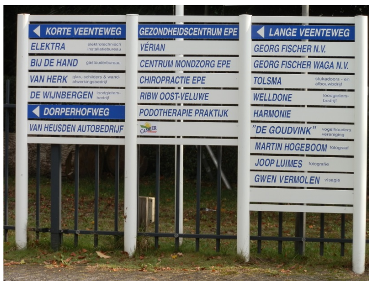
huidige bewegwijzing Kweekweg Noord te Epe

Zoals op de foto's in paragraaf 1.6. al is aangeven, beschikt industrieterrein Kweekweg in Epe, ten zuiden van de Oenerweg, over een verouderd, rommelig en niet consistent bewegwijzeringssysteem. Het gedeelte van industrieterrein Kweekweg, ten noorden van de Oenerweg, beschikt op het kruispunt Oenerweg – Korte Veenterweg wel over een moderner bewegwijzeringssysteem, echter leidt dit het onbekend (vracht)verkeer via de minder toegankelijke Korte Veenteweg naar de Lange Veenteweg en de Dorperhofweg. Deze route is vanuit verkeersveiligheidsoogpunt niet gewenst en vraagt om een aanpassing. De bewegwijzing is op dit deel van het industrieterrein verder ook niet consistent doorgevoerd. Op Industrieterrein Eekterveld in Vaassen worden weggebruikers vanaf de Spinfondsweg, Aalbosweg en Talhoutweg middels bedrijvenverwijzer/plattegrond-informatiekasten naar de bedrijven verwezen. De informatiekasten zijn echter niet overal evengoed zichtbaar voor lokaal onbekend verkeer.