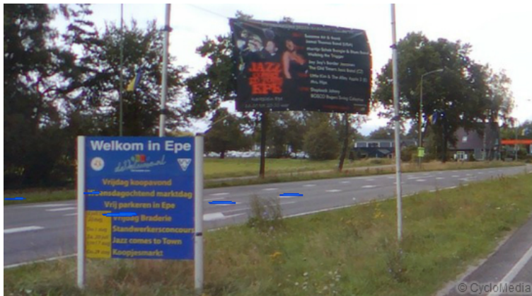
Evenementenbord in Epe

De kernen Emst en Oene hebben deze borden niet, maar in Oene leeft wel de wens om borden te plaatsen