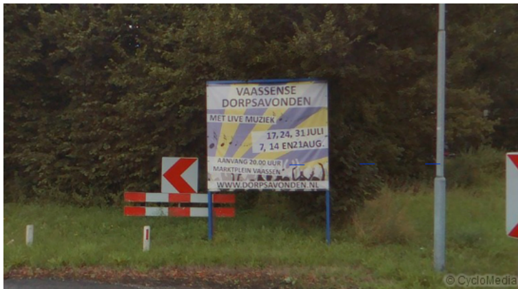
Spandoek met evenement in Vaassen