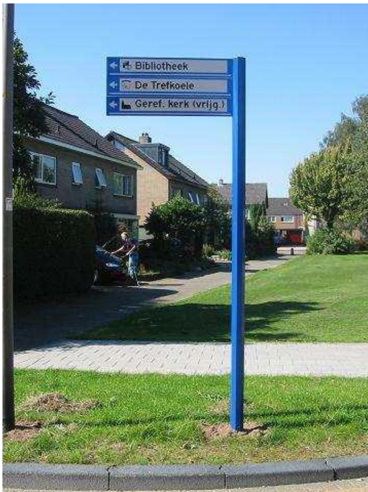
Mast met vanen