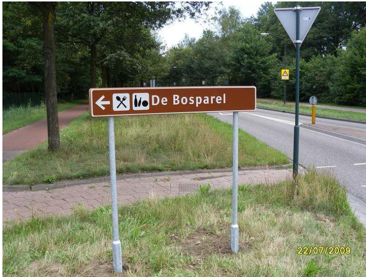
Groot model strokenbord

Eventueel kan gekozen worden om de strokenborden op een mast te plaatsen, als er onvoldoende ruimte is voor 2 flespalen.