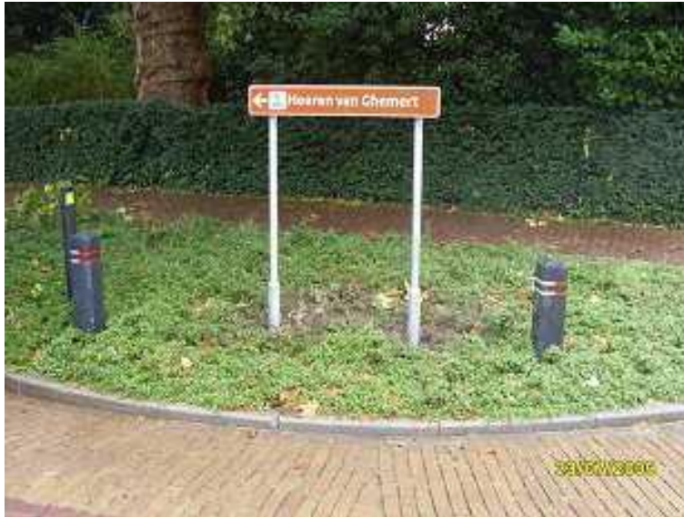
klein model strokenbord