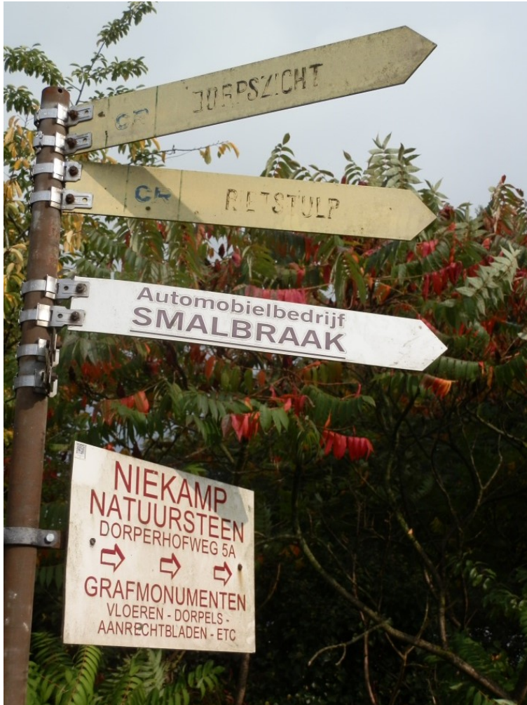
Bestaande verwijfsborden langs de Oenerweg richting industrieterrein Kweekweg te Epe