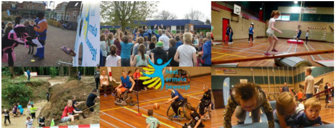
Voorbeeld: Heel Ermelo beweegt

Ook als vanuit het maatschappelijk veld een initiatief ontstaat, wordt nog steeds een beroep gedaan op de overheid om deze maatschappelijke doelen te helpen realiseren. Voor het merendeel van de initiatieven geldt dat de ondersteuning vanuit de overheid via geld, kennis of regelgeving nodig is om het initiatief te laten slagen of te continueren. We spreken dan van overheidsparticipatie. Overheidsparticipatie sluit goed aan op het paradigma van public value management.