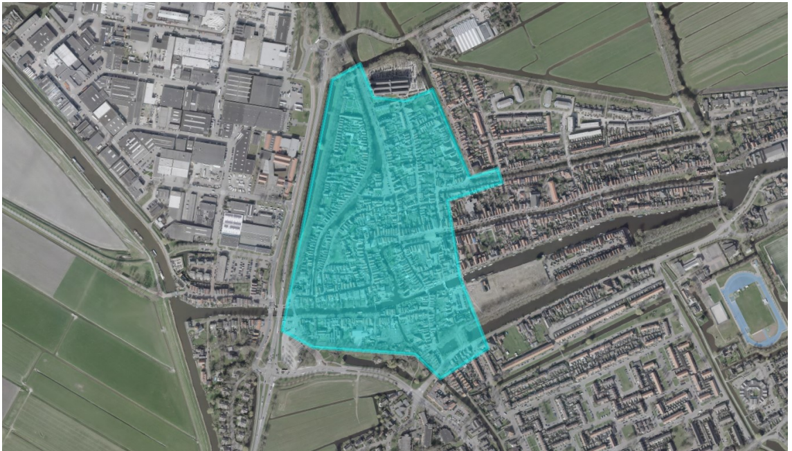
Kaart 2: Edam