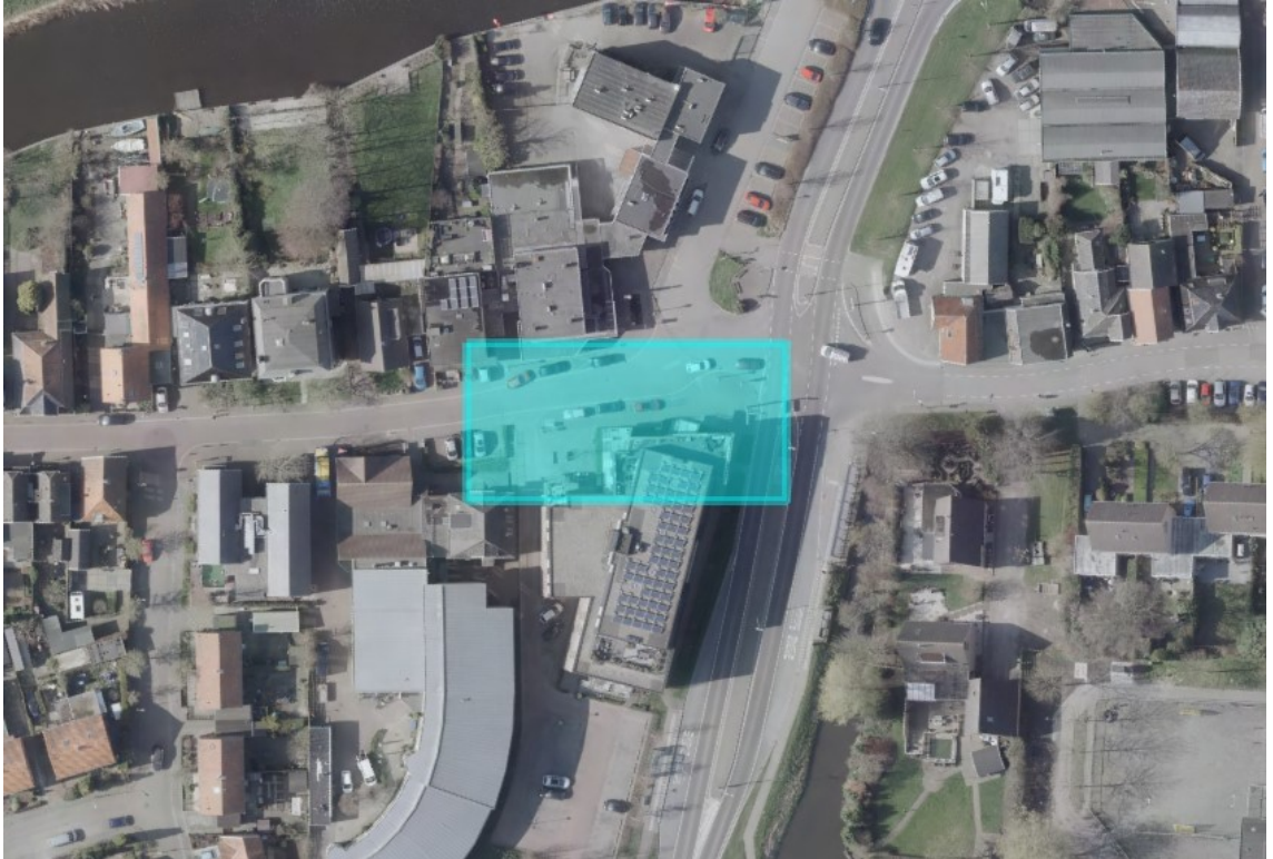
Kaart 3: Oosthuizen