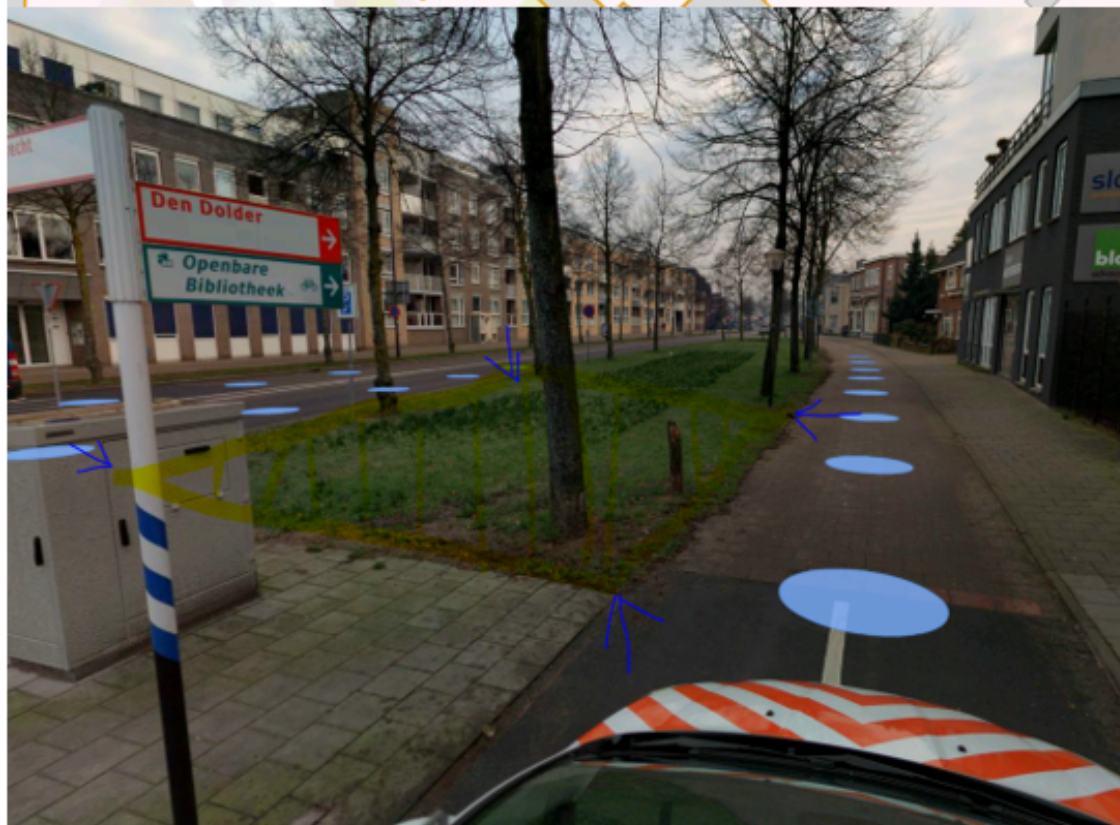
5. Wijk Sterrenberg, de uitlaatstroken, zoals aangegeven op bijgevoegde tekening;