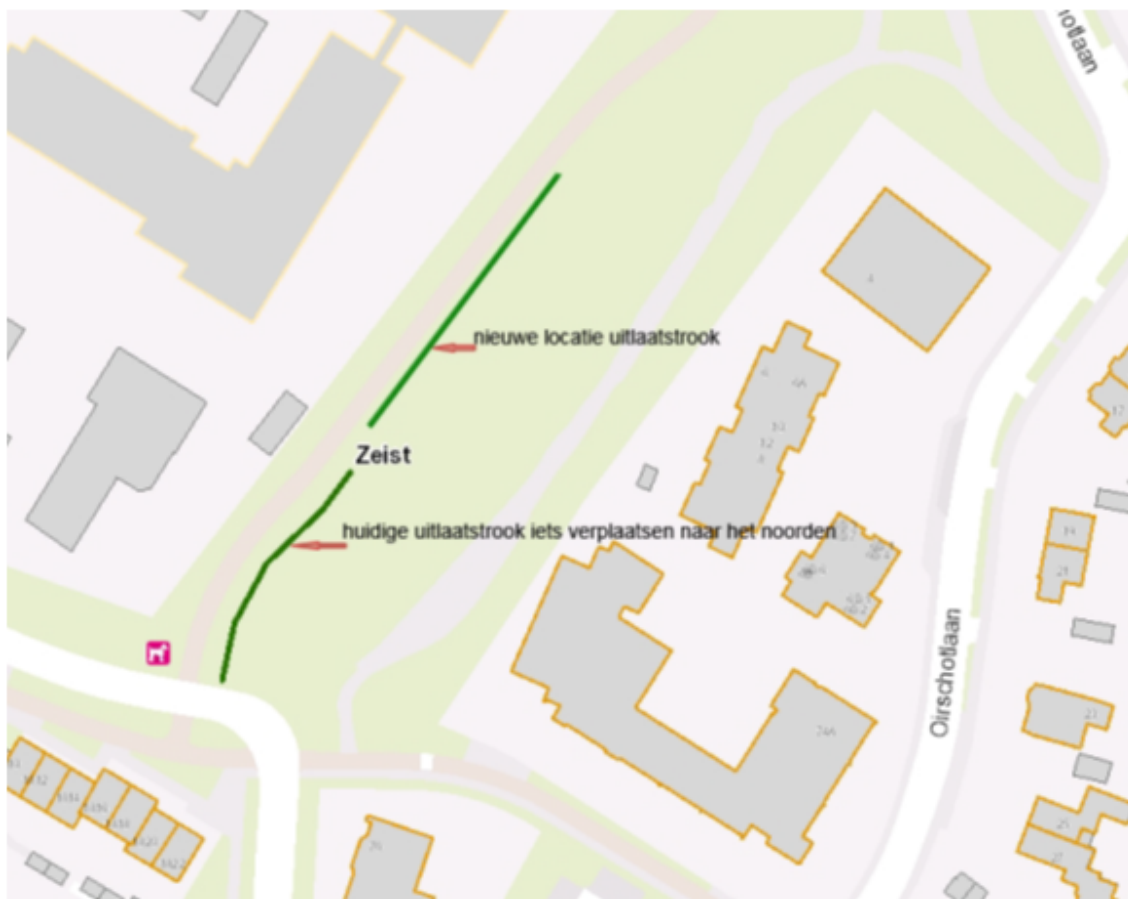
3. Beukbergen, de uitlaatstrook, zoals aangegeven op bijgevoegde tekening;