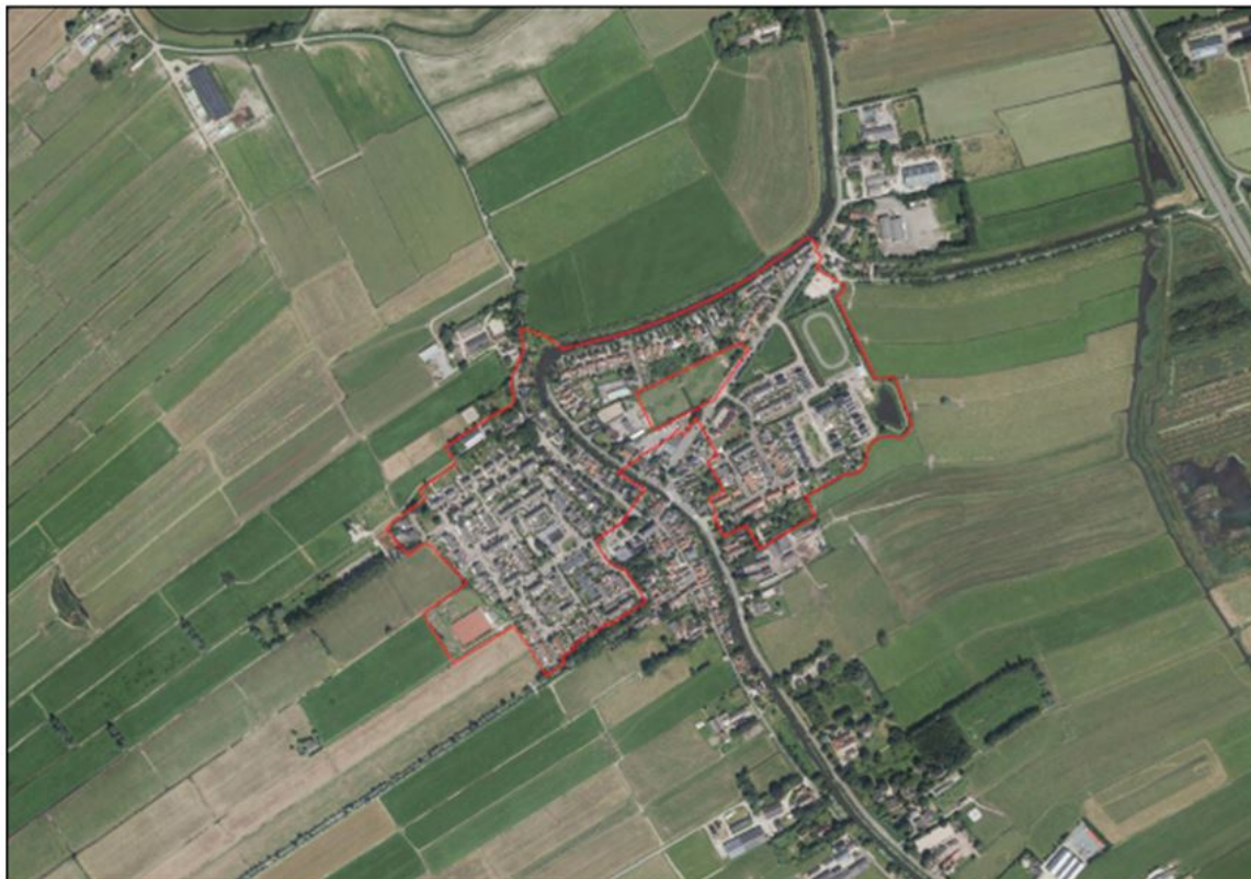
Figuur 1.1 Ligging verordeningsgebied

Dit resulteert in het verordeningsgebied zoals weergegeven in figuur 1.1.