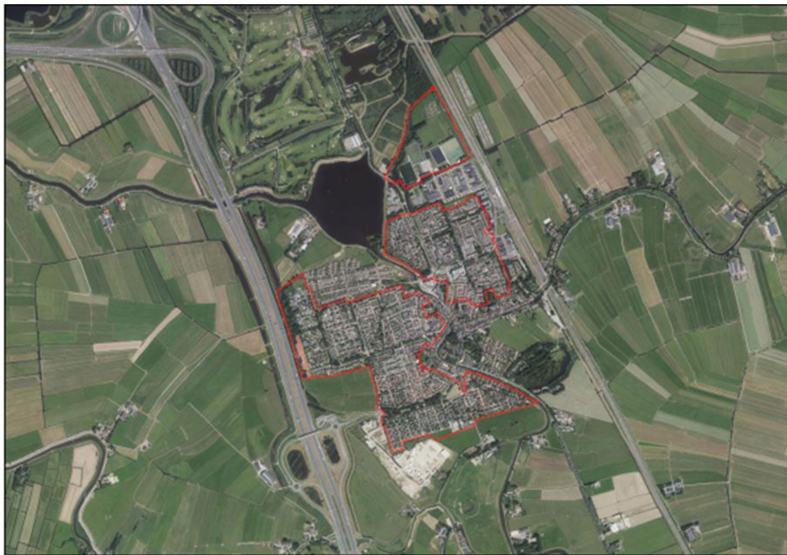
Figuur 1.1 Ligging verordeningsgebied

Dit resulteert in het verordeningsgebied zoals weergegeven in figuur 1.1.