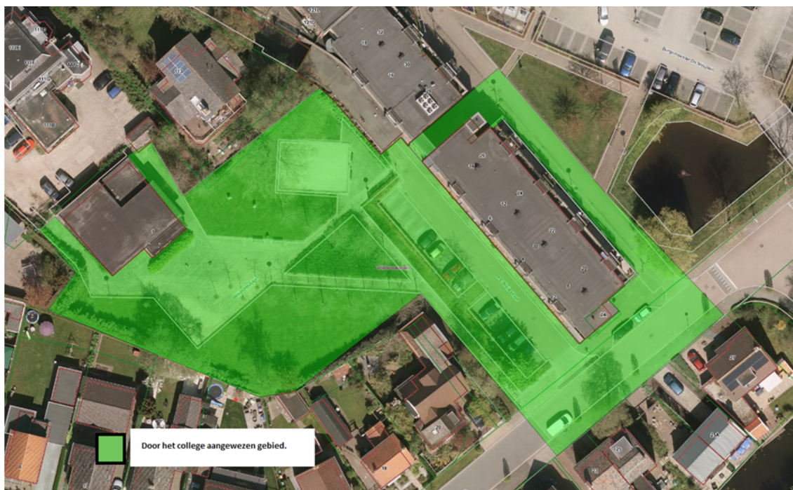
Gewaarmerkte situatie tekening 'Huiskamer':