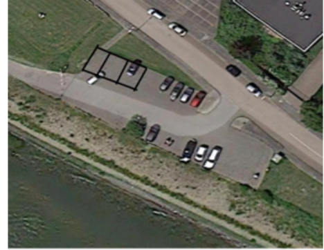
Parkeerterrein bij de Govert van Wijnkade: de zwarte vakken zijn de camperplaatsen