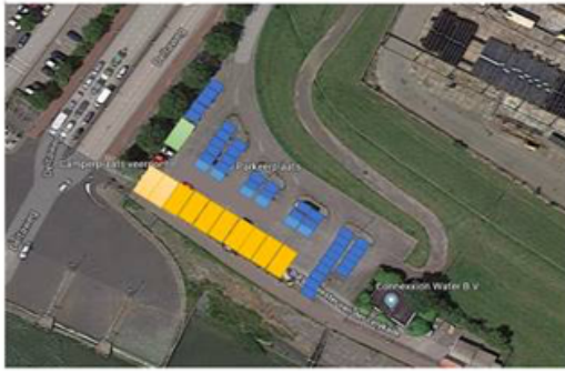
Parkeerterrein bij de Veerstoep: geel zijn de camperplaatsen en blauw de reguliere parkeerplaatsen waar het parkeerverbod geldt