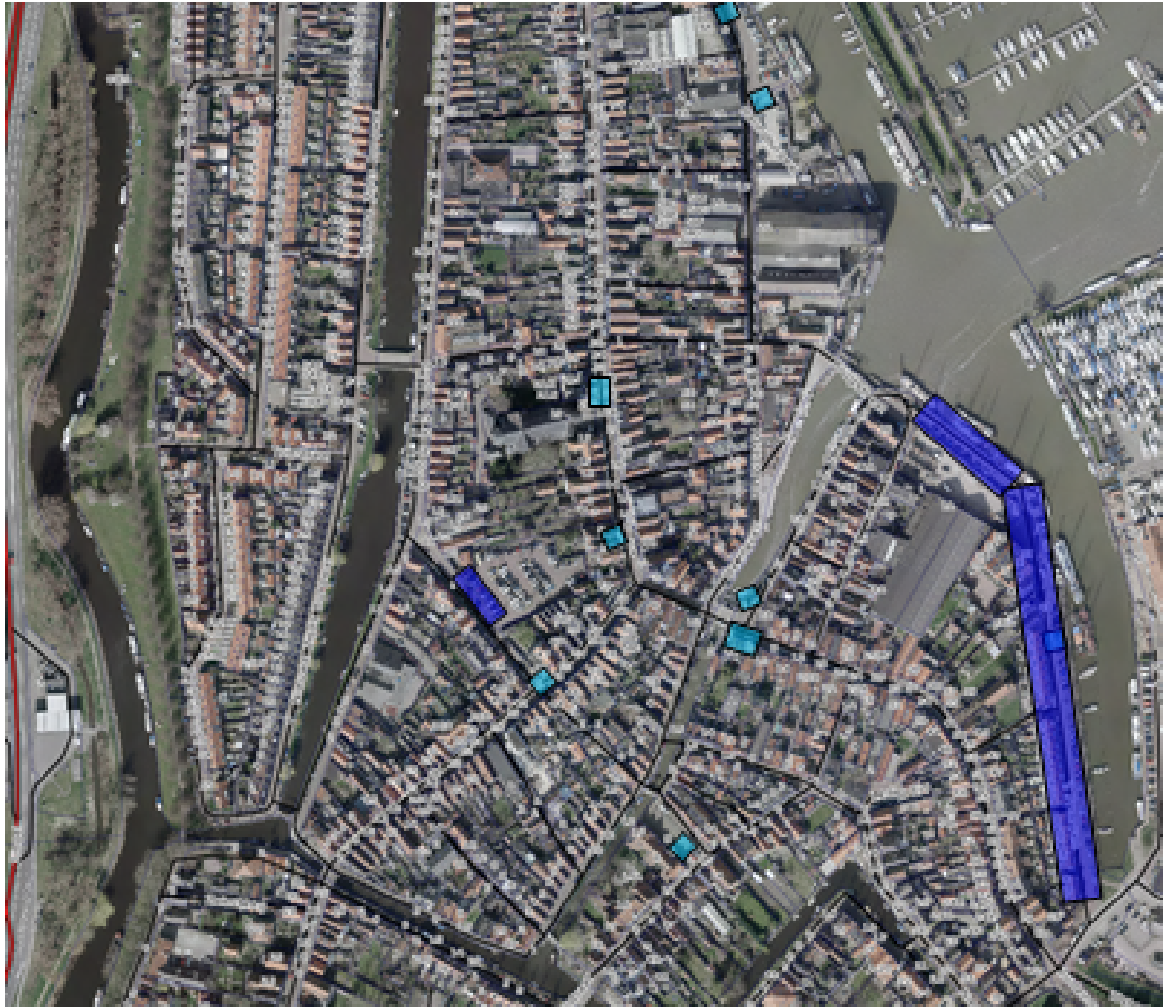
Kaart 3: Broek in Waterland