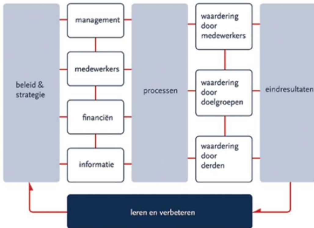
Figuur: overheidsontwikkelmodel , met links de zes organisatiegebieden en rechts de vier resultaatgebieden.

Om de kwaliteit te borgen ondernemen we de volgende activiteiten ten aanzien van de zes organisatiegebieden: