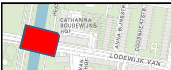
Situatietekening Brug 620 vaststellen Maria Woestenburgbrug