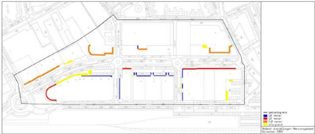
Geldingsgebied woonboulevard – Marconistraat