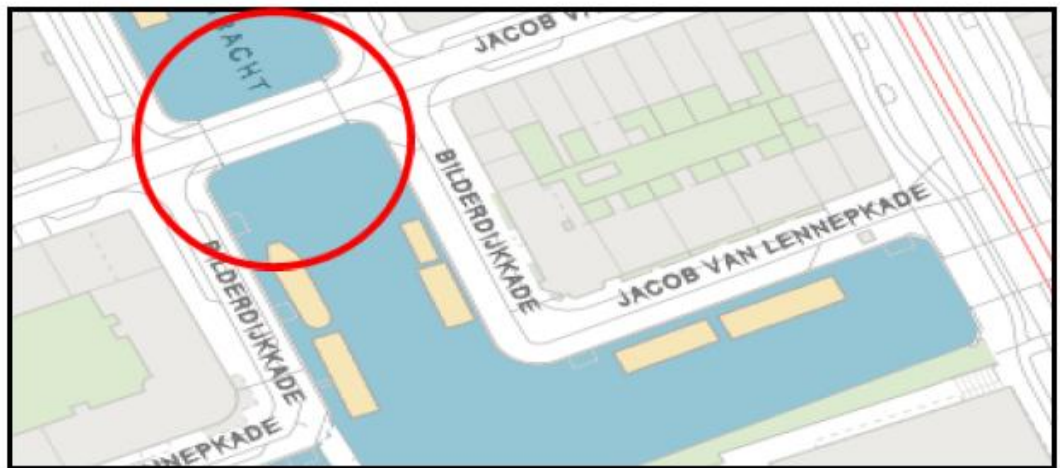
Brug 184 BELLE van ZUYLENBRUG