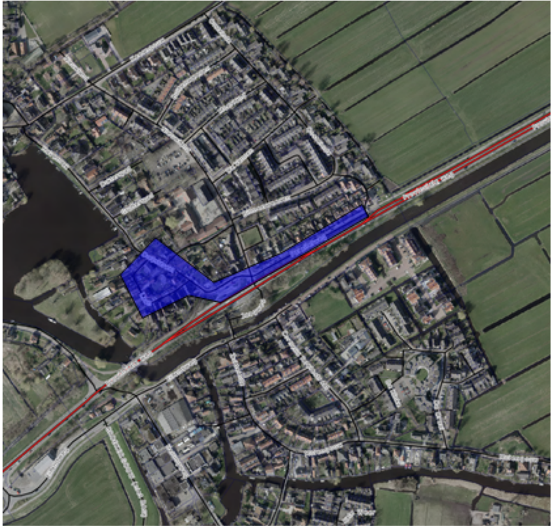
Kaart 5: Marken, Boxenring