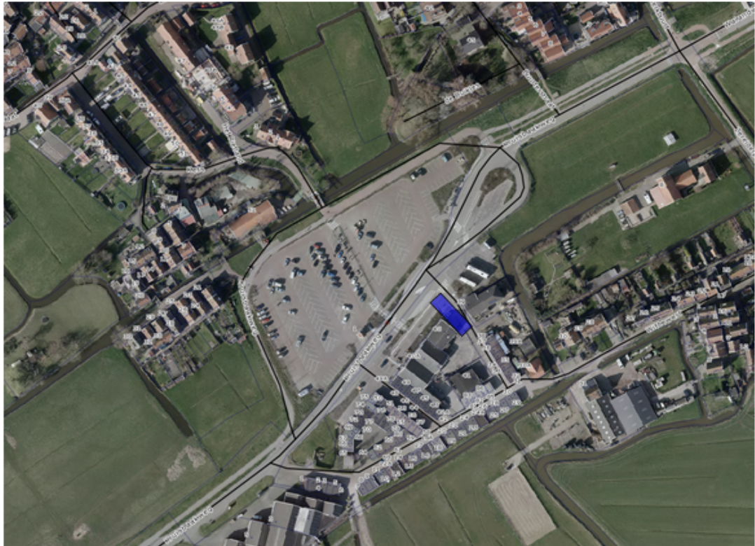
Kaart 6: Ilpendam, Aalduikerweg