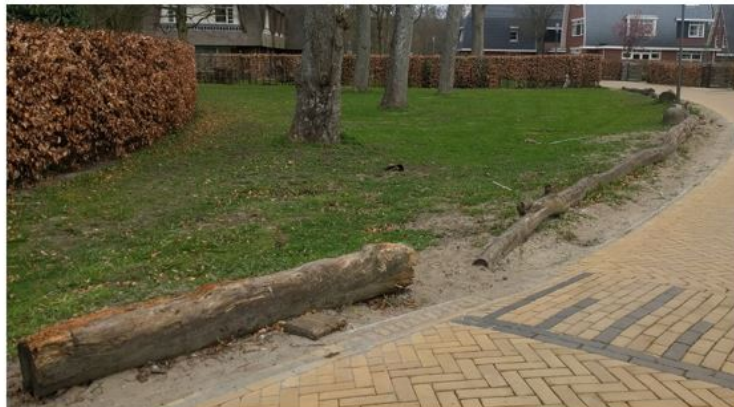
Natuurlijke materialen verouderen op een mooie manier. Beschadigde stalen of betonnen afscheidingen worden veel lager gewaardeerd dan bijvoorbeeld hout.