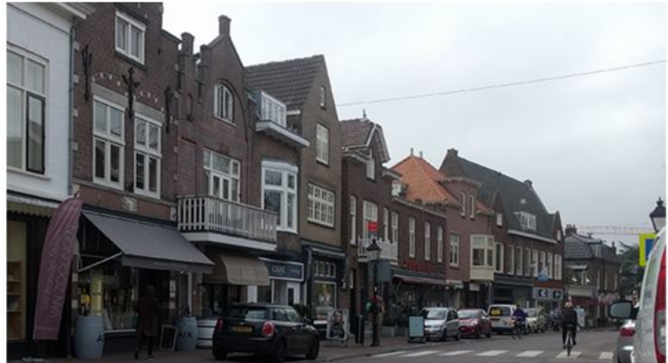
Het combineren van horeca, detailhandel en woningen zorgt voor een levendig centrumgebied. Het bundelen van voorzieningen zorgt tevens voor meer bezoekers en een vitaal centrum.