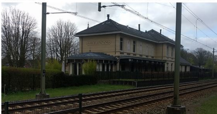
Door kwalitatief te bouwen, hebben gebouwen nog een tweede leven als de oorspronkelijke functie wegvalt. Dit voormalig stationsgebouw is nu, ondermeer, in gebruik als een restaurant.