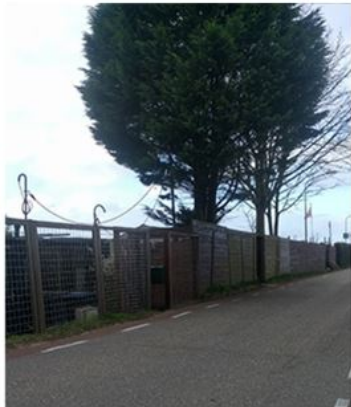
Erfafscheidingen naar de openbare ruimte geven vaak een rommelig beeld.