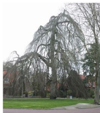
Geef bomen voldoende ruimte om volwassen te kunnen worden.