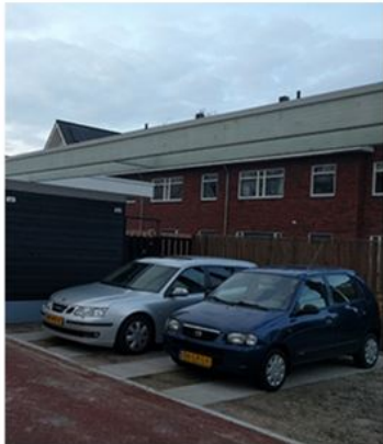
Er moet voldoende parkeer-ruimte zijn voor het gebruik van de plek.