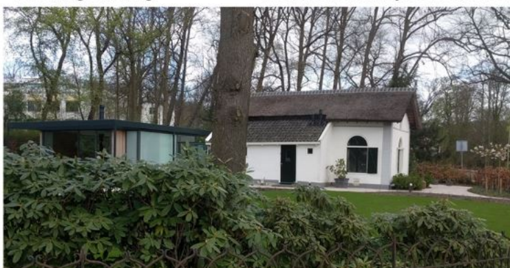
Oude gebouwen kunnen door een aanbouw worden aangepast aan hedendaagse wensen. Door contrast in architectuur blijft het verschil tussen oud en nieuw zichtbaar.