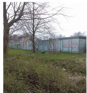
Door het gebruiken van alle ruimte, ontstaan er geen rest-ruimten.