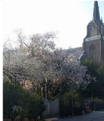
Planten en bomen hebben een sterke impact op de aantrekkelijkheid van een plek.