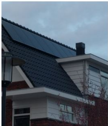
Duurzame energieopwekking zorgt voor een toekomstbestendige woning.