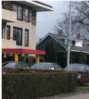
Door het camoufleren van auto's met een haag ontstaat er een fraai natuurlijk beeld.