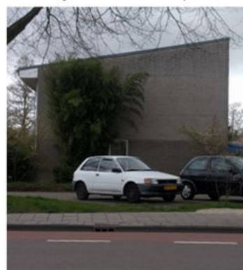
Gesloten gevels of achterkant-situaties dienen te worden vermeden.