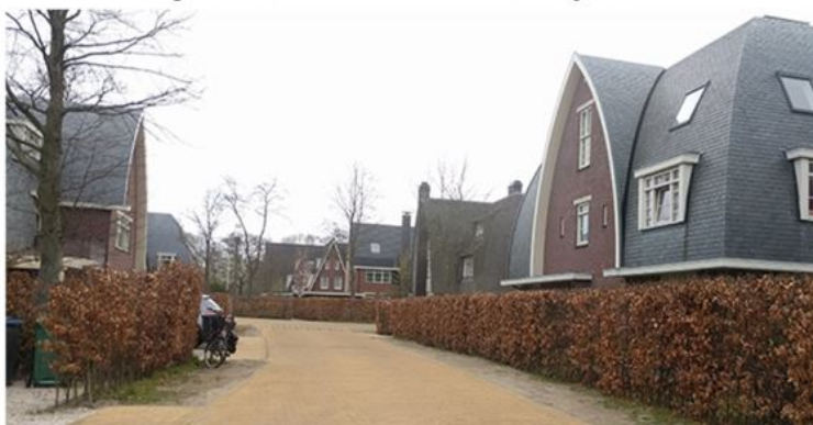
Een goede balans tussen verscheidenheid en uniformiteit zorgt voor een aantrekkelijke omgeving. Dit geldt voor zowel architectuur als in de buitenruimte.