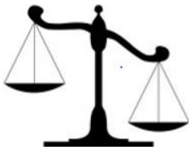
Figuur 4: Gedogen, een afweging van belangen

Partieel handhaven is hetzelfde als partieel gedogen. Artikel 5.2. Awb geeft een wettelijke grondslag voor de gedeeltelijke handhaving in uitzonderingssituaties. Een dergelijk besluit is feitelijk niets meer dan twee aspecten in één brief. Bijvoorbeeld, in een last onder dwangsom wordt opgenomen dat de overtreding dient te worden beëindigd, doch dat geen bedragen zullen worden verbeurd indien de vergunninghouder zich houdt aan de in de last omschreven voorschriften. Het voordeel van deze constructie wordt gezien in het feit dat de voorschriften bij een (partiële) last onder dwangsom - in tegenstelling tot de gedoogbeschikking - rechtstreeks handhaafbaar zijn. Bij een gedoogbeschikking dient volgens jurisprudentie bij de overtreding van de voorwaarden eerst de gedoogbeschikking (gedeeltelijk) te worden ingetrokken alvorens tot handhaving kan worden overgegaan (deze besluiten kunnen natuurlijk in één brief worden genomen). Feitelijk wordt echter onder de noemer van een partiële last onder dwangsom ter zake van de overtreding een gedoogbeschikking met voorwaarden genomen.