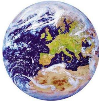
Figuur 1: De te beschermen omgeving