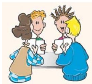
Figuur 5: Beter resultaat door samenwerken

In onderstaande tabel 5 zijn ook de overige overleggen genoemd, met daarbij de belangrijkste kenmerken per overleg. Alle genoemde overleggen worden 'Wabo-breed' georganiseerd.