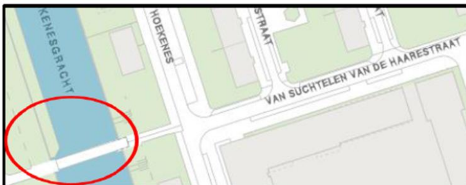
Brug 765 : Jan Brouwerbrug