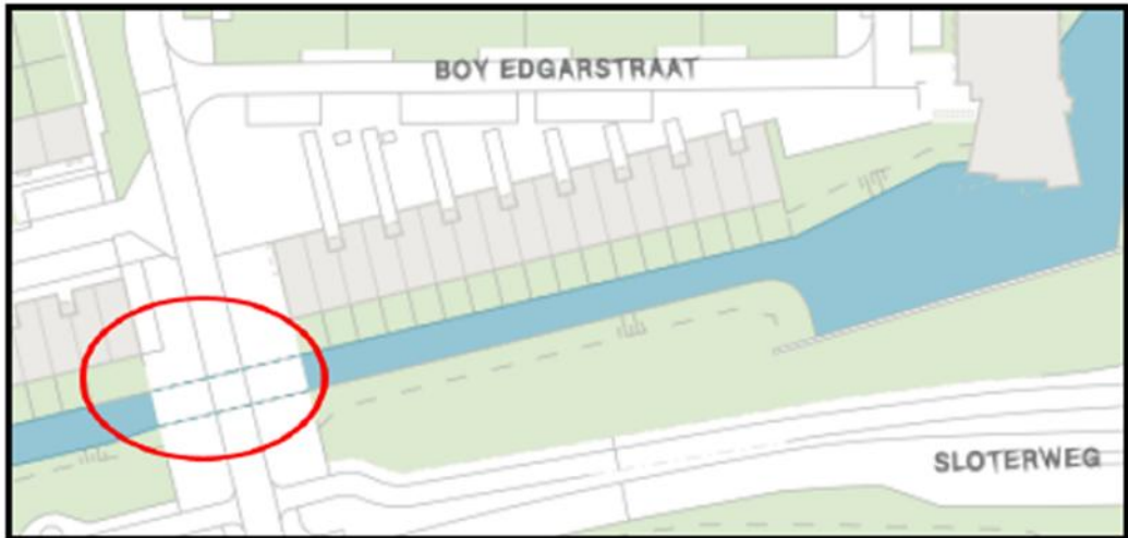
Brug 1868 : Pia Beckbrug