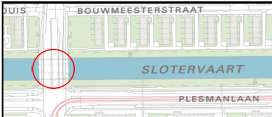
Brug 701 : Bloeddonorbrug