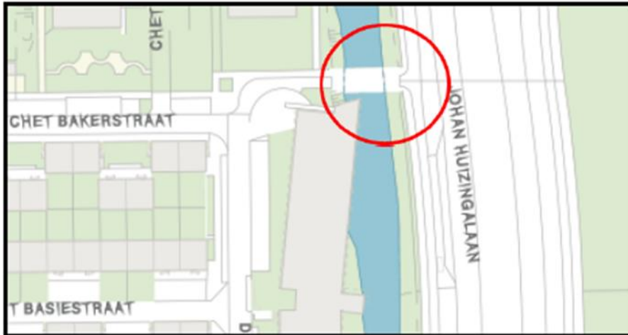
Brug 1866 Rita Reysbrug