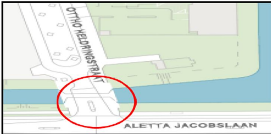
Brug 714 : Henny de Swaanbrug