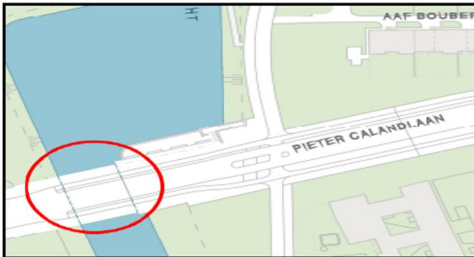
Brug 715 : Piet Bakkerbrug