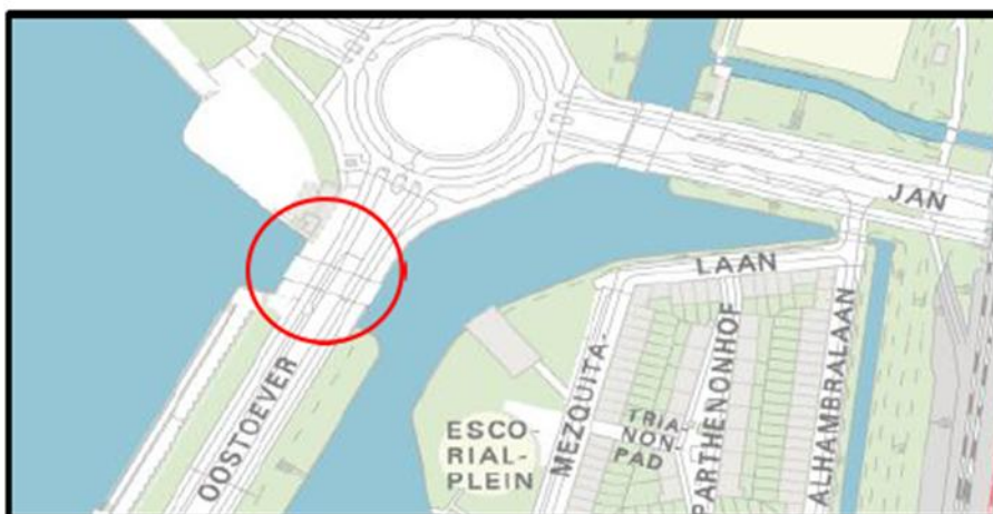
Brug 607: Conny van Rietschotenbrug