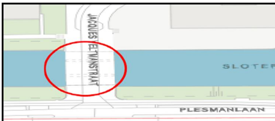
Brug 709 : Frans van Goolbrug