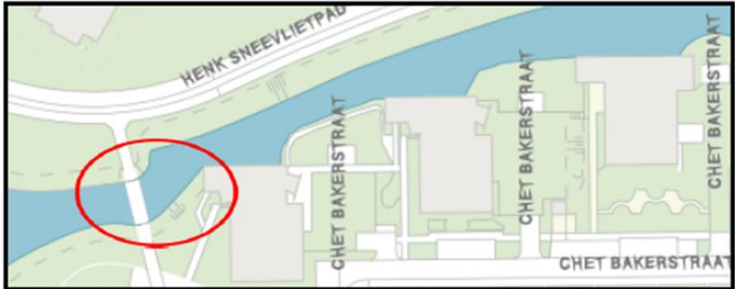
Brug 1867 : Bessie Smithbrug