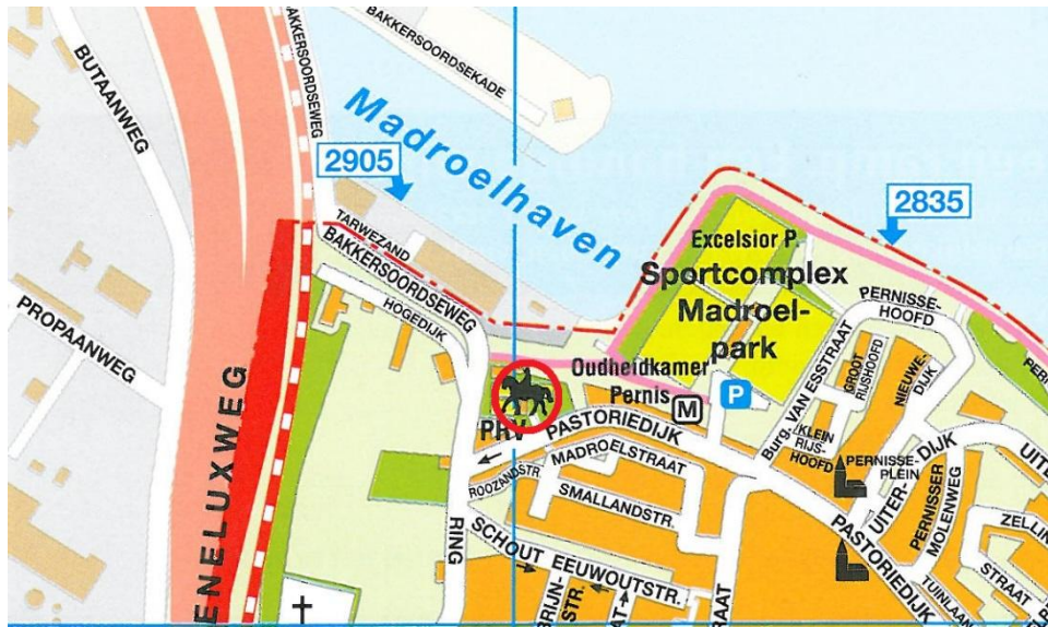
Kinderboerderij 't Groene Woud (Pastoriestraat, Pernis)