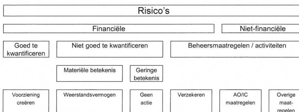
Figuur Schema maatregelen risico's

Nadat de risico's zijn geïdentificeerd, geanalyseerd en waar mogelijk gekwantificeerd, worden maatregelen getroffen en activiteiten in gang gezet. Hierbij wordt de onderstaande indeling worden gebruikt: