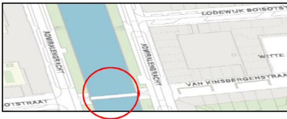
Brug 129: Groentepraambrug