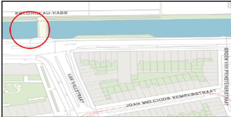
Brug 1973: De Arendbrug