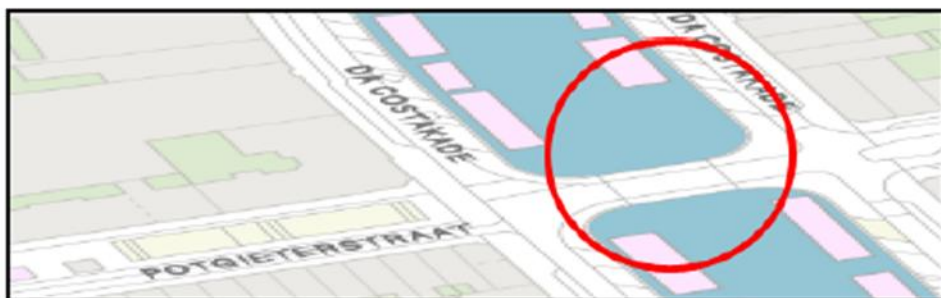
Brug 138: Jacob Craandijkbrug