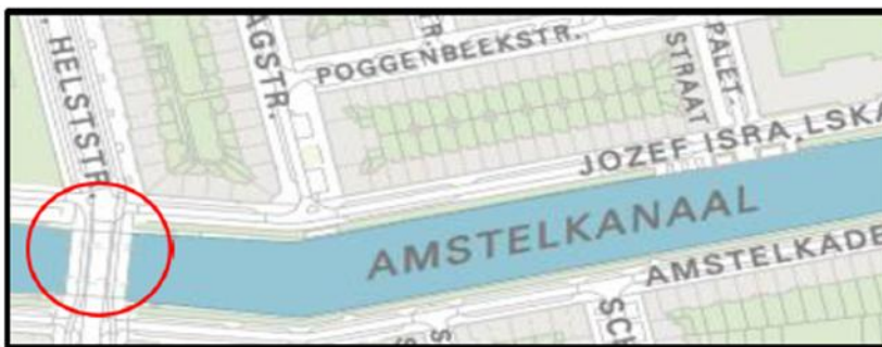
Brug 403: Gerard Revebrug