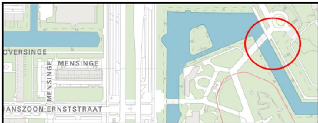
Brug 838: Ben Ali Libibrug