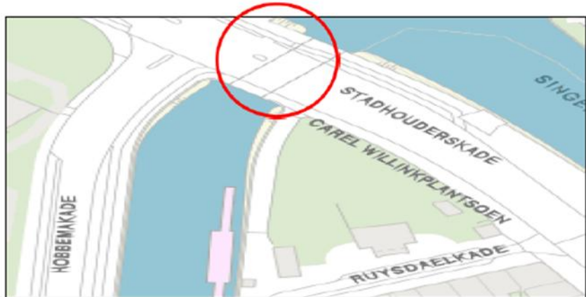
brug 176: Judith Leysterbrug