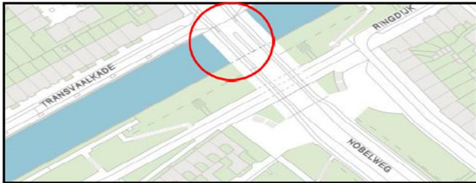
Brug 256: Kaap de Goede Hoopbrug