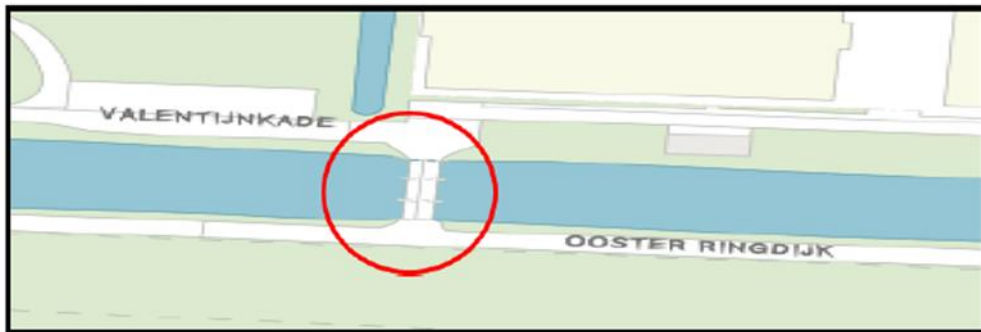
Brug 195: Henrietta Leavittbrug