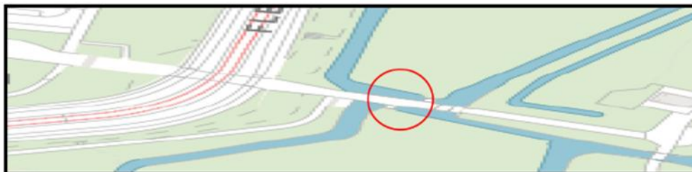
Brug 196: Titaantjesbrug