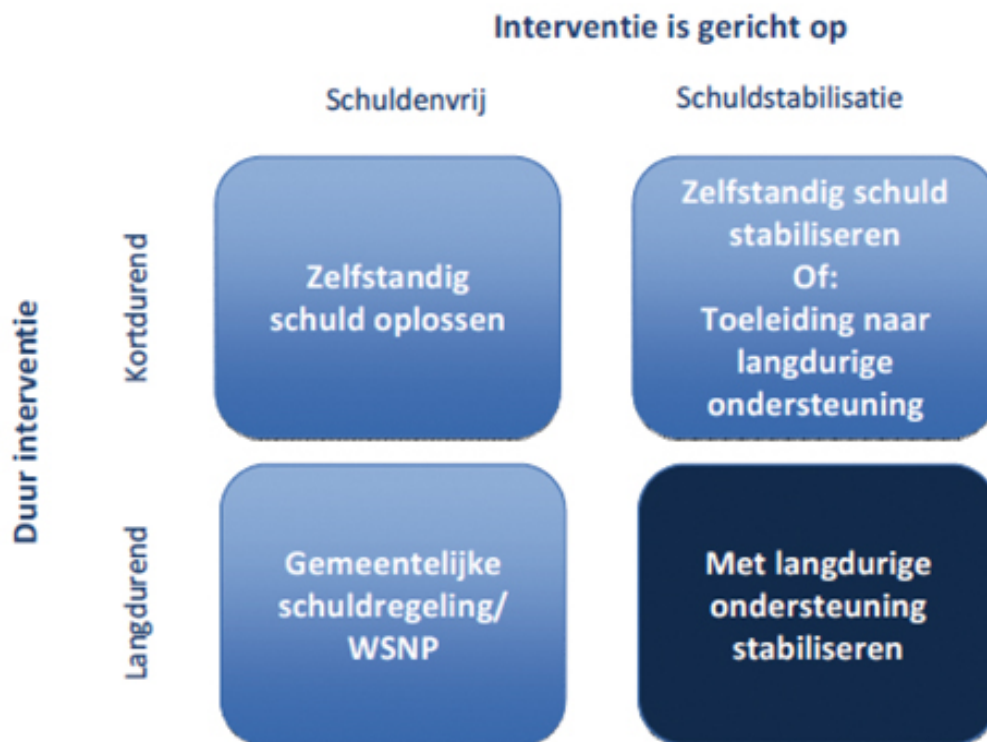
Figuur: kwadranten schuldhulpverlening 5

Door screening wordt men meteen verwezen naar de juiste hulpverlener binnen onderstaande kwadranten. Daarbij wordt niet alleen gekeken naar de schulden, maar vooral ook naar gedrag en motivatie van de schuldenaar.