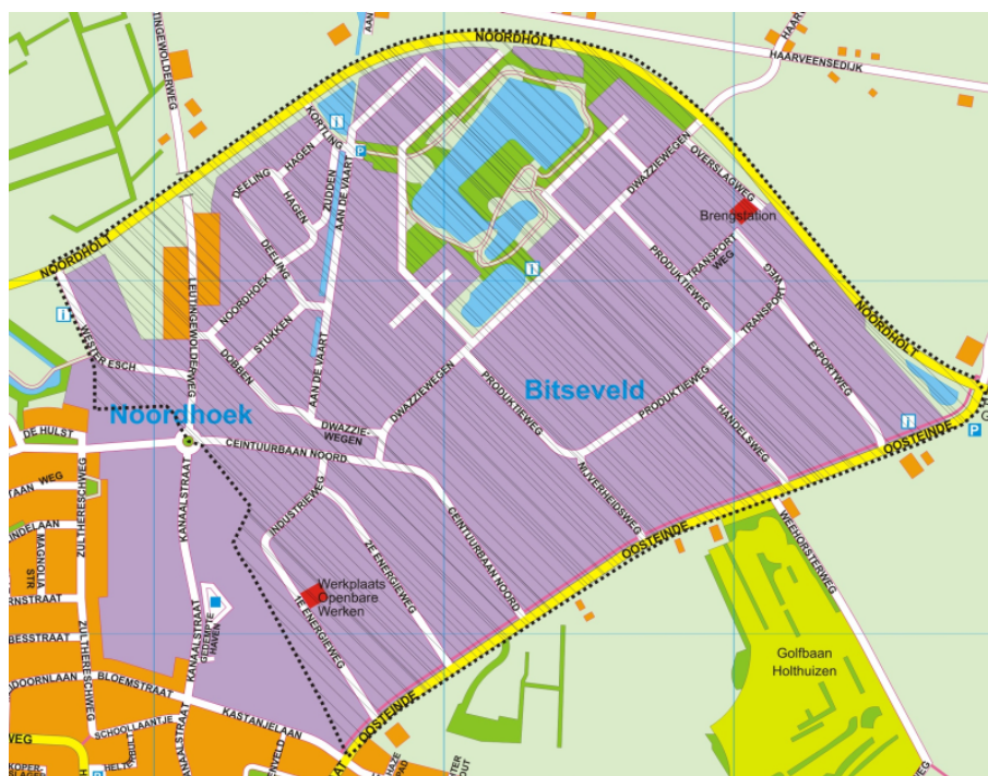
Bijlage 3: Kaart van de BI-zone 'Bedrijventerrein Peize' als bedoeld in artikel 1, onderdeel a, van deze verordening.

Het gebied Bedrijventerrein Peize wordt omsloten door de onderstaande straten. Alle objecten gelegen aan en binnen de op de kaart aangegeven stippellijn vallen binnen de BI-zone 'Bedrijventerrein Peize':