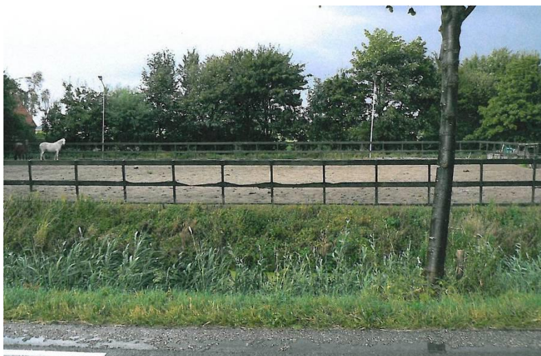
Een bestaande paardenbak die voor de voorgevel aan de weg is gerealiseerd.

In Hollands Kroon zijn er veel paardenbakken, longeercirkels en stapmolens gerealiseerd. Voor de meeste is nooit een vergunning aangevraagd. Tegen alle bestaande gevallen, die passen binnen de uitgangspunten van dit beleid, wordt niet actief opgetreden. Het kan zijn dat een bestaande paardenbak niet past binnen het nieuwe paardenbeleid. Hollands Kroon houdt rekening met bestaande paardenbakken (peildatum 1 maart 2014) die direct aan het bouwblok/(woon)erf grenzen. Indien er geen overlast wordt veroorzaakt mogen zij blijven bestaan. Dit wordt per geval bekeken. Er kan de bureu om een verklaring van geen bezwaar worden gevraagd. Verder wordt er gekeken naar de intensiteit van het gebruik van de paardenbak en het aantal gehouden paarden. Zodra het paardenbeleid in een bestemmingsplan is verwerkt, moet de eigenaar alsnog een vergunning aanvragen voor de gerealiseerde bouwwerken. Wij adviseren een burger die een bestaande paardenbak, longeercirkel of een stapmolen heeft, alsnog een omgevingsvergunning aan te vragen. De bouwwerken blijven anders illegaal. Hollands Kroon stimuleert de eigenaren de voorzieningen landschappelijk in te passen.