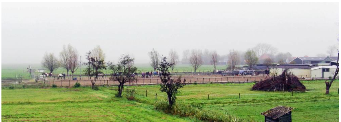
Fout: paardenbak dominant in het landschap aanwezig