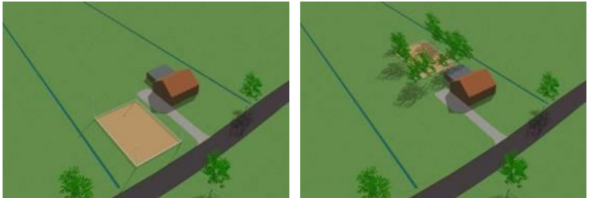
Fout: Paardenbak te dominant aanwezig Goed: paardenbak "verstopt" in het groen

De paardenbak, longeercirkels en stapmolens kunnen wat betreft de landschappelijke inpassing het best op het eigen erf worden gerealiseerd. Bovendien is het erg praktisch om de voorziening niet te ver van de stal te situeren. Als aanleg op het eigen erf niet mogelijk is, dan kan het erf visueel worden vergroot. Dit kan worden gedaan door de voorziening aangrenzend aan het erf te plaatsen en de randen van het erf te beplanten met opgaande beplanting. Het planten van een haag van ongeveer een meter van de paardenbak, longeercirkel en stapmolen met een haag van ongeveer één meter hoogte betekent wel een ruimtelijke meerwaarde.