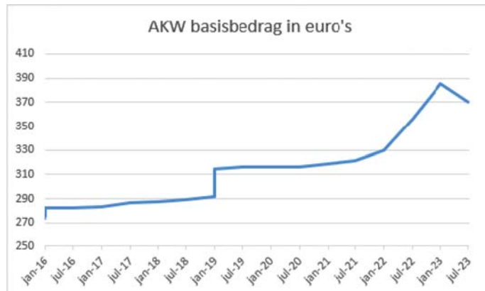
Figuur 2: de ontwikkeling van het AKW basisbedrag in euro's per kwartaal.

Figuur 2 laat zien hoe het kwartaalbedrag aan kinderbijslag zich heeft ontwikkeld sinds januari 2016. Door de hoge inflatie in 2022 is de kinderbijslag de afgelopen twee kwartalen aanzienlijk gestegen met ongeveer € 55 1 . Daardoor is de kinderbijslag vanaf 1 juli 2023, ondanks de negatieve indexatie, € 44 per kwartaal hoger dan in januari 2022. Op 1 januari 2024 volgt een nieuwe indexering van de kinderbijslag. Deze wordt gebaseerd op de prijsontwikkeling tussen april 2023 en oktober 2023.