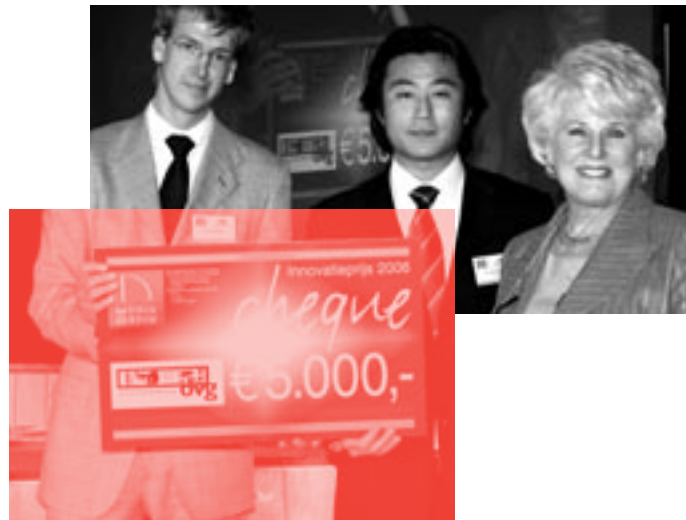
Minister Karla Peijs van Verkeer en Waterstaat reikte de NieuwBouw Innovatieprijs uit aan de bedenkers van ArchiSelect.

Waar het de afgelopen jaren vooral ging om de voorbereiding, zal de nieuwe Regieraad zich nadrukkelijker gaan bezighouden met de uitvoering. Als belangrijke aandachtspunten noemde de minister het bouwonderwijs dat meer hoogopgeleide mensen moet afleveren, een betere samenwerking tussen kennisinstituten, het verminderen van faalkosten en professionalisering van het opdrachtgeverschap.