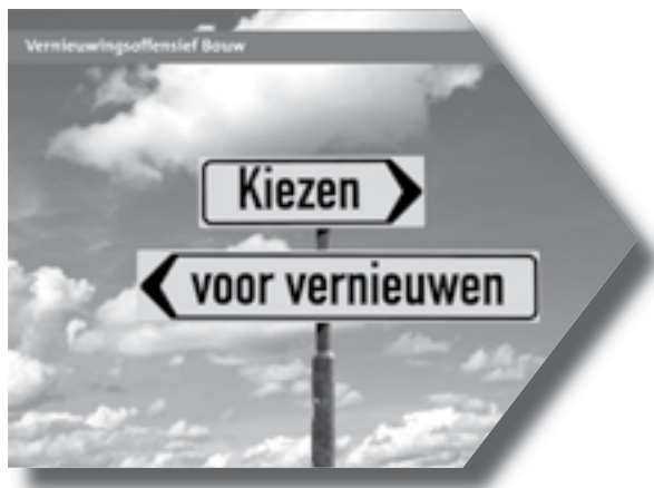
De brochure "Kiezen voor vernieuwen" is verspreid onder 15.000 bedrijven en instellingen in de bouwsector.

Er is bewust gekozen voor één en dezelfde brochure voor opdrachtgevers en opdrachtnemers. Hiermee wordt duidelijk gemaakt dat het vernieuwingsproces alleen kans van slagen heeft als dat van beide kanten gelijktijdig in gang wordt gezet.