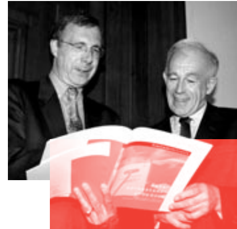
De sleutelpublicatie 'Beter aanbesteden in de bouw' werd namens de Regieraad door Michiel Scheltema aangeboden aan minister Laurens Jan Brinkhorst van Economische Zaken.