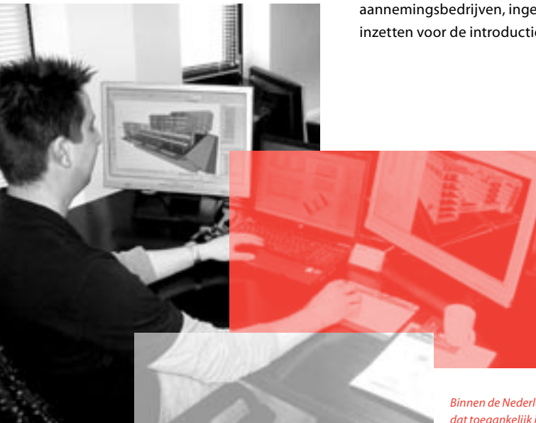
Binnen de Nederlandse bouwsector wordt het Bouwwerk Informatie Model (BIM) geïntroduceerd, dat toegankelijk is voor alle bij een project betrokken bouwpartijen.

In december maakte PSIBouw bekend dat er een landelijke Bouw Informatie Raad (BIR) is gevormd. Hierin zitten vertegenwoordigers van rijksopdrachtgevers en de vier grote steden, aannemingsbedrijven, ingenieursbureaus, toeleveranciers en architecten. De BIR gaat zich inzetten voor de introductie en brede toepassing van het BIM in de Nederlandse bouwsector.