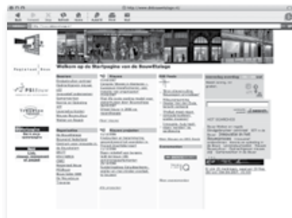
De website www.debouwetalage.nl ontwikkelt zich tot de startpagina voor iedereen die geïnteresseerd is in 'het nieuwe bouwen'.

De BouwEtalage "nieuwe stijl" werd op 14 december voor het eerst gepresenteerd tijdens het evenement "Metamorfose van de bouw". Verwacht wordt, dat de website medio 2007 volledig operationeel zal zijn.