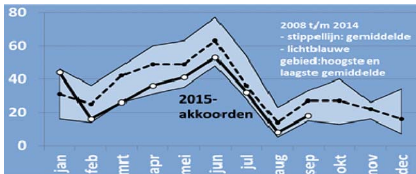
Figuur 2: Aantal akkoorden per maand, 2008 t/m 2015

Noot: Het aantal akkoorden voor de zomermaanden zal nog (iets) kunnen oplopen als later alsnog nieuwe akkoorden bekend worden.