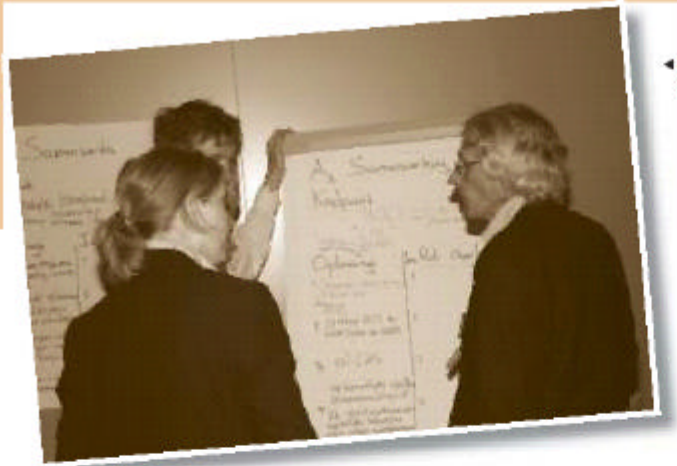
◀ Rode en groene stickers plakken bij de stellingen uit de workshops

ken neer. "Je moet geloven in je eigen kracht en de regio opzoeken." Zo ziet hij kansen in samenwerking met het groene hbo. Niet zo direct voor doorstroom – dat levert hem immers geen nieuwe leerlingen op – maar door de afstroom. "Nogal wat eerstejaars hbo-studenten vallen in het eerste jaar uit. Zoals harvisten. Dat komt vaak omdat ze in het voortgezet onderwijs een te hoog advies hebben gekregen." AOC Limburg biedt deze afstromers onderdak zodat ze een groene mbo-kwalificatie krijgen en mogelijk beter geëquipeerd als nog hun hbo-route kunnen vervolgen.