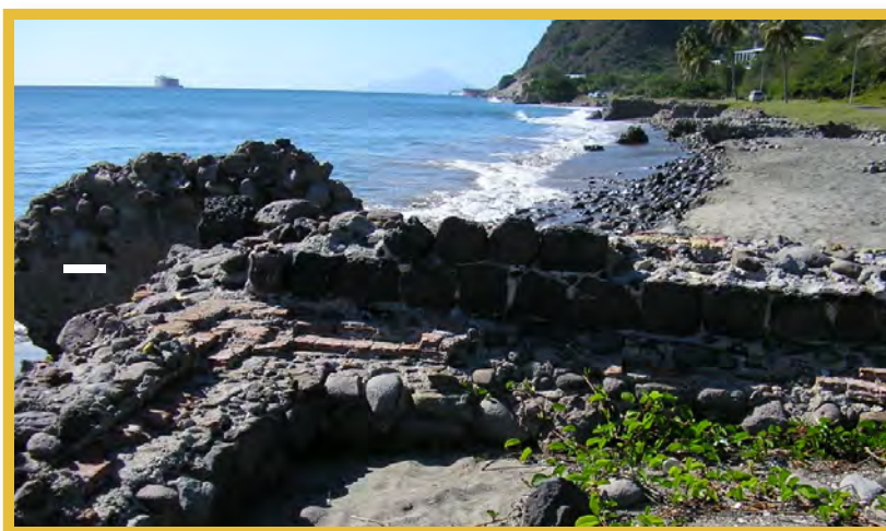
Afbeelding 2 Resten van historische pakhuizen, St. Eustatius

Deze paragraaf beschrijft óf en zo ja, in hoeverre inhoud en strekking van het Verdrag van Malta zijn terug te vinden in de thans geldende wetgeving voor de openbare lichamen Bonaire, Sint Eustatius en Saba. Een samenvatting van de wetgeving van Sint Maarten, Curaçao en Aruba volgt aansluitend. Voor de Caribische context is een bijzondere wet van Puerto Rico vermeld.