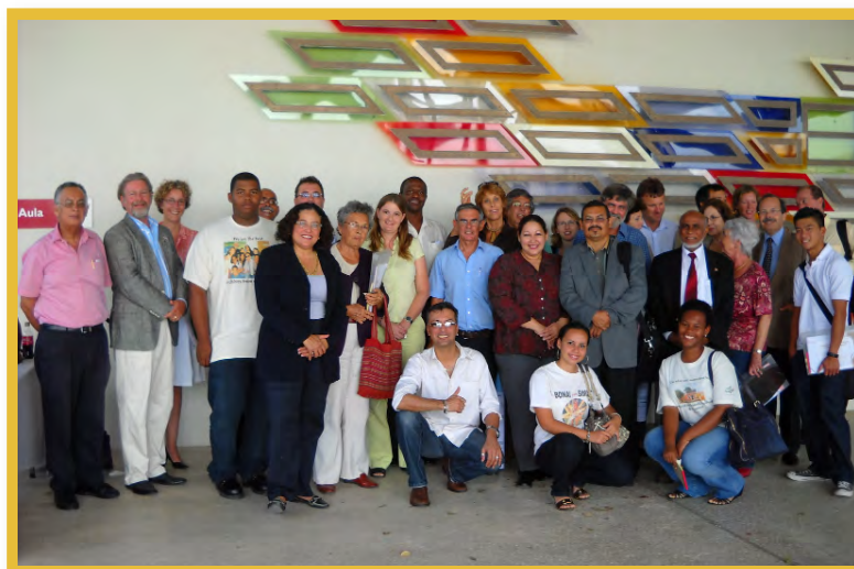
Afbeelding 16 Deelnemers Seminar Cultural Heritage Legislation in Caribbean Perspective 2009, Curaçao

Om andere eilanden te stimuleren Malta te implementeren en praktijkkennis uit te wisselen, heeft NAAM in 2005 en 2009 een seminar gehouden waar de Nederlands Caribische en enkele andere Caribische landen, zoals Puerto Rico en Trinidad & Tobago, vertegenwoordigd waren. De seminars waren een groot succes, niet in de laatste plaats omdat 'eiland' zijn bepaalde overeenkomsten in de uitvoering van archeologiebeleid met zich mee brengt. In de toekomst zal dit zeker een vervolg krijgen.