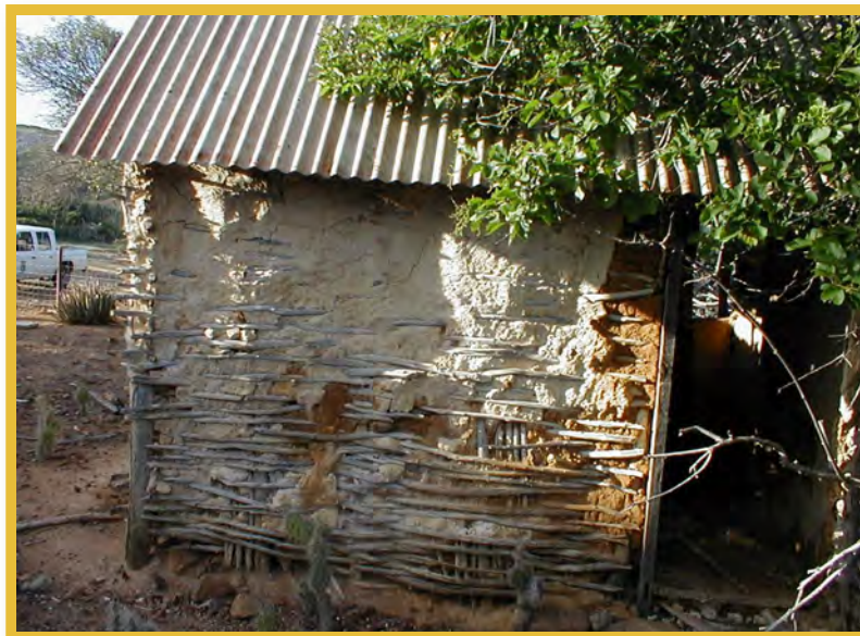
Afbeelding 13 Kas di bara, Bonaire

Om verder te kunnen voldoen aan dit onderdeel van het Verdrag is het nodig om belangrijke vindplaatsen wettelijk te beschermen en de vindplaatsenlijst uit te breiden met historische, Afro-Caribische en maritieme vindplaatsen. Voorts moet een meldpunt voor alle archeologievondsten en illegale activiteiten worden aangewezen.