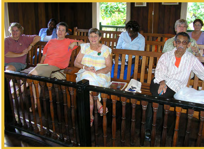
Afbeelding 9 Leden van de St. Eustatius Historical Foundation

Monumenteneilandsverordening ontwikkeld.