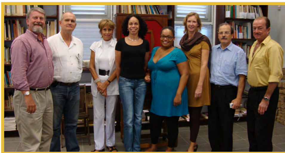
Afbeelding 1 Leden werkgroep Verkenning implementatie Malta BES

Sleutelfiguren uit St. Maarten en Curaçao hebben positief op de uitnodiging gereageerd en een vertegenwoordiger in de werkgroep benoemd. Voor wat betreft Aruba is gecorrespondeerd met het National Archaeological Museum Aruba (NAMA), dat een bijdrage heeft gestuurd over de status van het archeologiebeleid op Aruba.