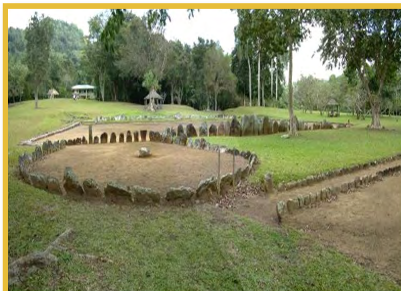
Afbeelding 8 Batey de Utuado, Caguana, Puerto Rico