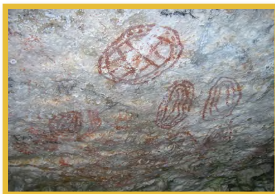
Afbeelding 14 Precolumbiaanse rotstekeningen te Spelonk, Bonaire

Ontwikkelingsplannen hebben momenteel geen post voor archeologie op de begroting. DROB streeft ernaar om dergelijk onderzoek (en eventueel behoud) te laten financieren door de ontwikkelaar, zoals reeds in Nederland en Curaçao gebeurt. Gezien de huidige ontwikkelingen zal op korte termijn het eerste Malta project op Bonaire plaatsvinden.