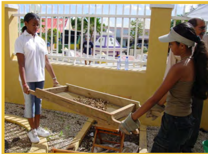
Afbeelding 12 Jongeren op cursus bij BONAI, Bonaire

Het Bonaire Archaeological Institute (BONAI) laat jongeren kennis maken met erfgoed en voert sinds 2010 onder andere onderzoek uit in samenwerking met de faculteit Archeologie van de Universiteit Leiden.