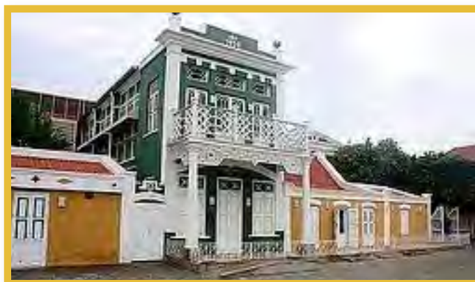
Afbeelding 7 Nationaal Archeologisch Museum Aruba (NAMA)

Aruba kent een wettelijk stelsel voor de bescherming van monumenten dat vergelijkbaar is met dat van Sint Maarten en Curaçao volgens de nu geldende wetgeving. Implementatie van het Verdrag van Malta heeft nog niet plaatsgevonden.