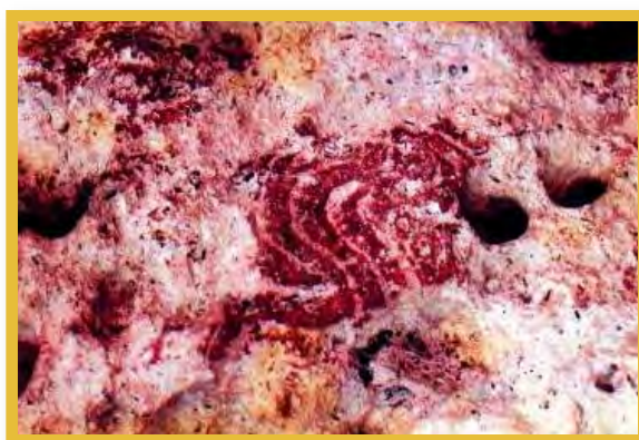
Afbeelding 5 Rotsschilderingen San Juan, Curaçao

De landen Sint Maarten en Curaçao kennen op dit moment nog de Monumentenlandsverordening 1989 15 en de respectievelijke Monumenteneilandsverordeningen 16 . Beide hebben krachtens het overgangsrecht op 10 oktober 2010 de status van landsverordeningen van Sint Maarten en Curaçao verkregen.