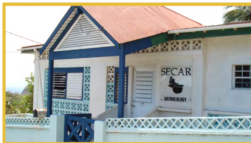
Afbeelding 10 St. Eustatius Center for Archaeological Research (SECAR)

Het St. Eustatius Center for Archaeological Research (SECAR) voert momenteel al het archeologisch onderzoek uit. SECAR is in 2000 opgezet als een non-profit onderzoeksgroep van de St. Eustatius Historical Foundation. Sinds 2008 is SECAR een zelfstandige stichting met een archeoloog als directeur. Deze is in dienst bij het openbaar lichaam. Giften en bijdragen van studenten, amateurarcheologen en vrijwilligers die vanuit de hele wereld komen om onder deskundige leiding deel te nemen aan opgravingen, dekken alle operationele kosten.