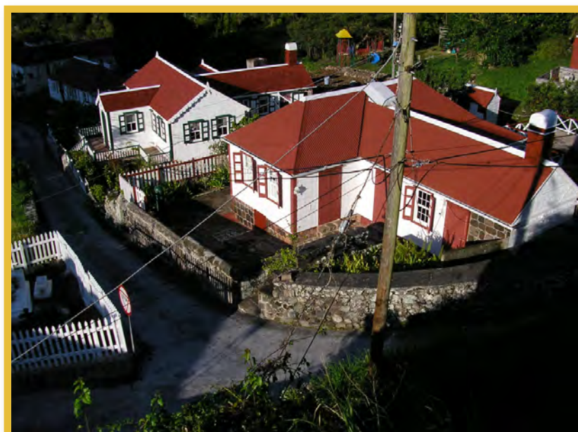
Afbeelding 4 The Bottom, Saba

Van belang is verder dat artikel 13 van deze Eilandsverordening de onderhoudsplicht van de eigenaar van een beschermd monument expliciet uitbreidt tot 'daartoe behorende muren of erfafscheidingen'. De Monumenteneilandsverordening van Sint Eustatius kent een overeenkomstige bepaling (artikel 12). Voor het overige zie paragraaf 2.2.1 (Sint Eustatius).