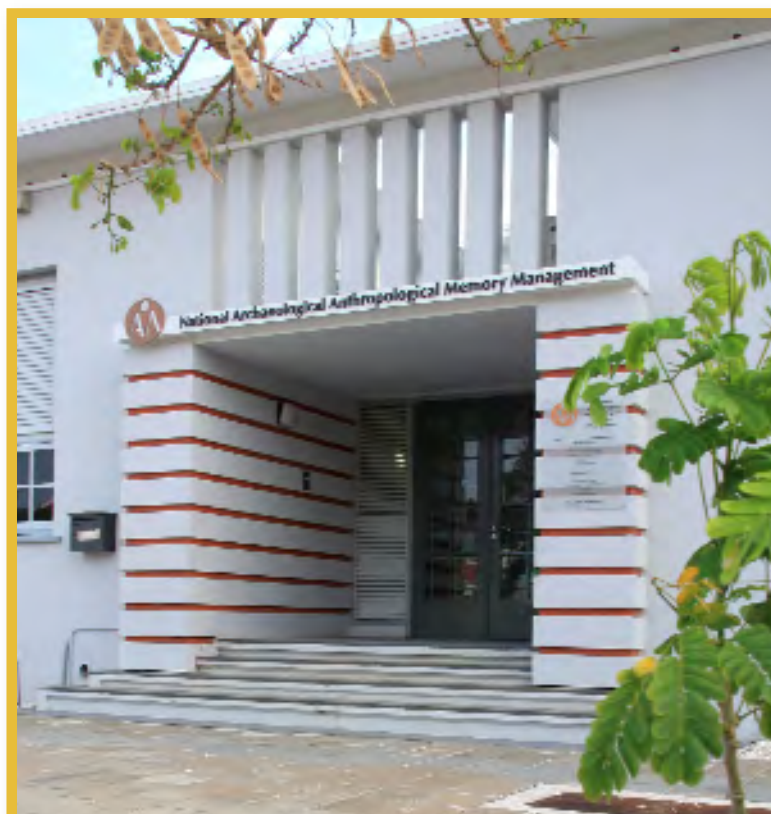
Afbeelding 11 National Archaeological Anthropological Memory Management, Curaçao

NAAM heeft in maart 2010 een werkprotocol met het Bestuurscollege van Sint Eustatius afgesloten waarin is overeengekomen dat de stichtingen die zich lokaal met erfgoedbeheer bezig houden, projecten in samenwerking met NAAM kunnen uitvoeren.