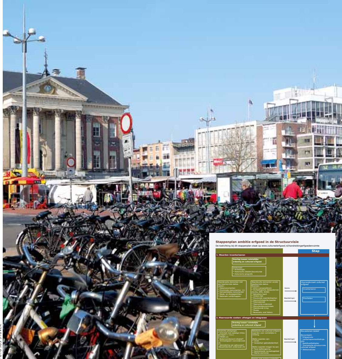
De Grote Markt van Groningen

Voeg uw eigen praktijkvoorbeeld toe op www.cultureelerfgoed.nl/handreikingerfgoedenuimte