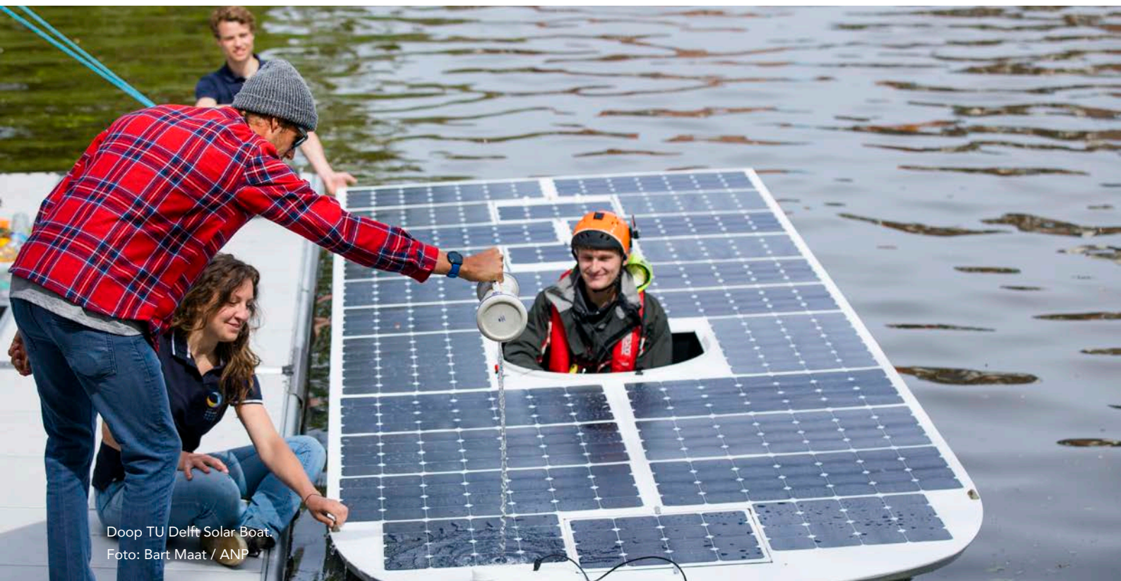
Doop TU Delft Solar Boat.

Onze samenleving heeft kennis nodig. Kennis, die wordt ontwikkeld door verschillende organisaties en experts. Kennis om bijvoorbeeld te innoveren, of om politieke keuzes te onderbouwen. De afgelopen jaren brachten we de publieke kennisinfrastructuur steeds beter in beeld. Universiteiten, hogescholen, onderzoeksinstituten van de KNAW en NWO, TO2-instellingen, rijkskennisinstellingen. Maar ook hun partners zoals bedrijven en gemeenten. We introduceerden het concept 'kennisecosystemen'. Dit begrip geeft aan dat kennis voor nu en de toekomst, tot stand komt in een dynamisch samenspel.