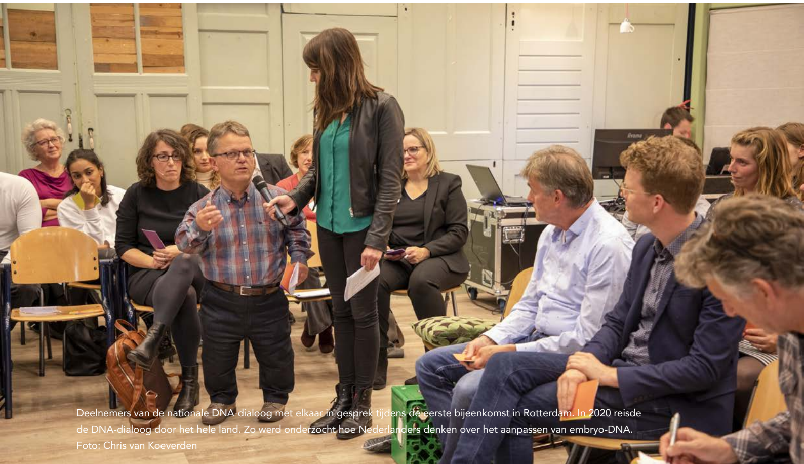
Deelnemers van de nationale DNA-dialoog met elkaar in gesprek tijdens de eerste bijeenkomst in Rotterdam. In 2020 reisde de DNA-dialoog door het hele land. Zo werd onderzocht hoe Nederlanders denken over het aanpassen van embryo-DNA.

Het Rathenau Instituut onderzoekt al jarenlang de impact van medisch wetenschappelijk onderzoek. Over kwesties rond gezondheidstechnologie wordt in de Nederlandse samenleving heel verschillend gedacht. Ook onze omgang met de natuur en onze leefomgeving stelt ons vaak voor dilemma's. Met nieuwe vormen van dialoog ondersteunen we de komende jaren het politieke en maatschappelijke debat hierover.