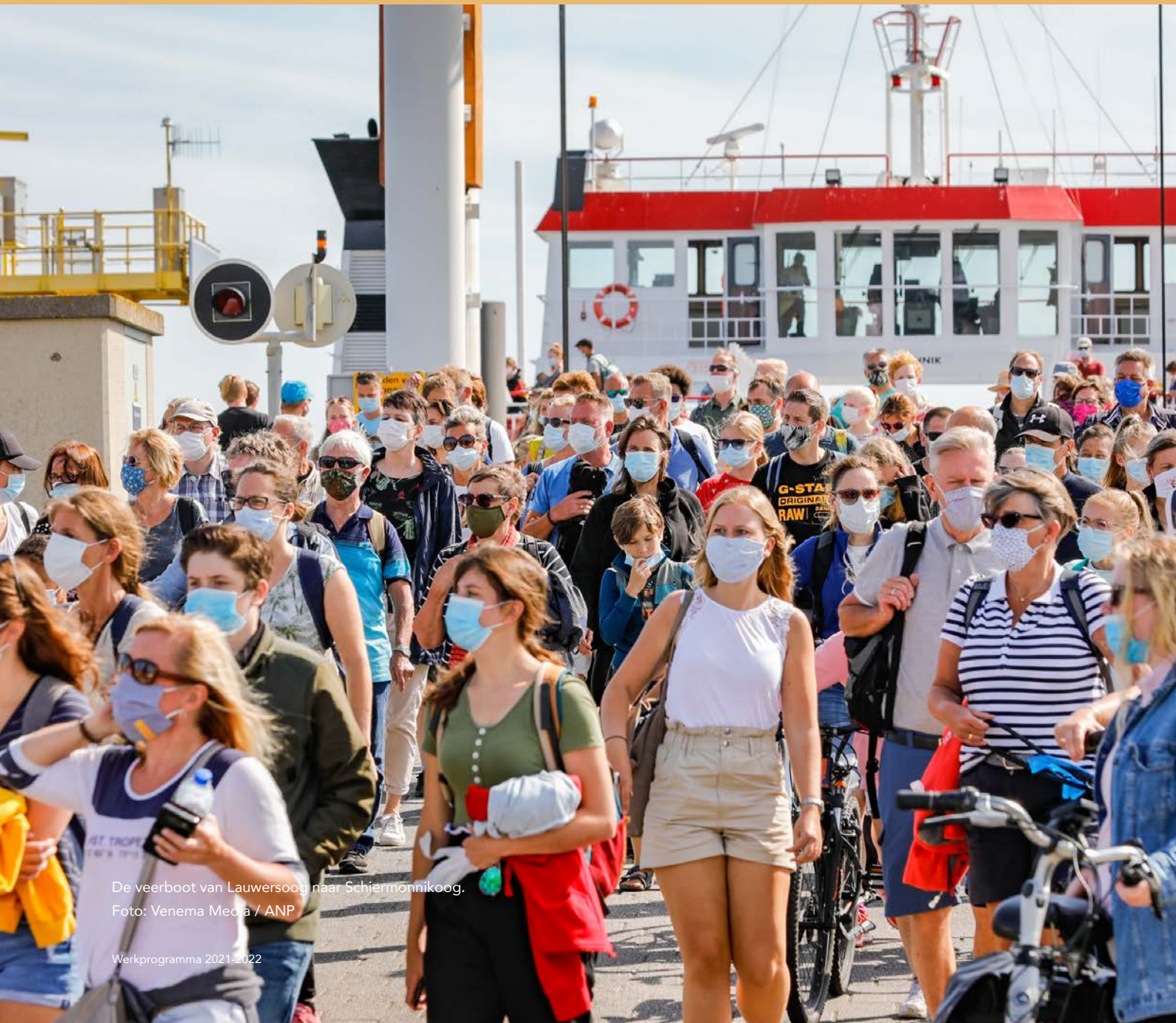
De veerboot van Lauwersoog naar Schiermonnikoog.

Deze thema's werkt het Rathenau Instituut in 2021 en 2022 uit: Digitale samenleving, Maakbare levens, Democratische informatie- samenleving en Vitale wetenschap en kennisecosystemen.