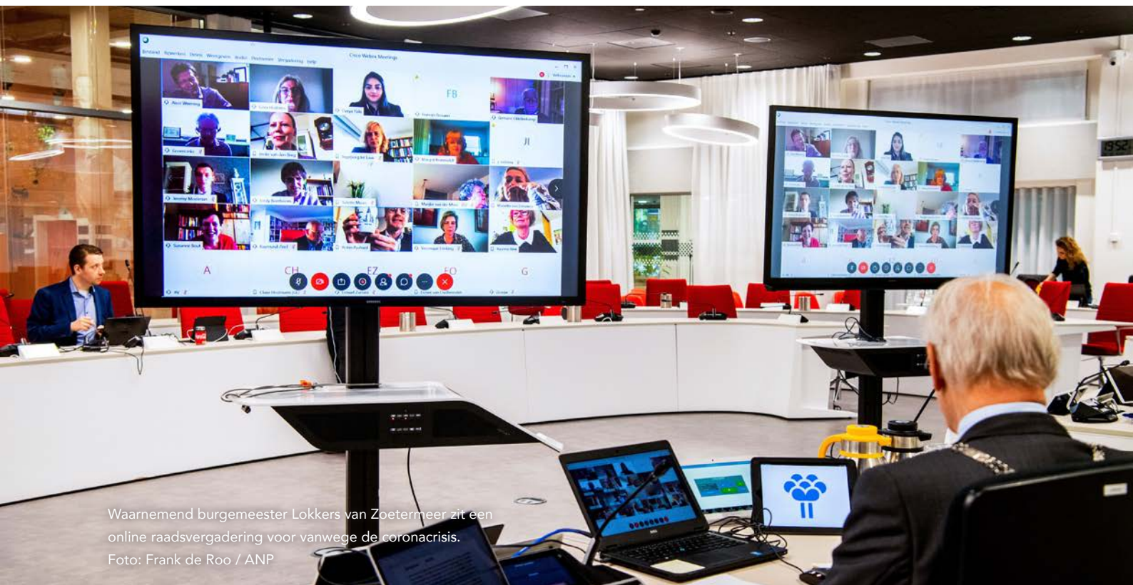
Waarnemend burgemeester Lokkers van Zoetermeer zit een online raadsvergadering voor vanwege de coronacrisis.

Het Rathenau Instituut doet al sinds de jaren '80 onderzoek naar de rol van kennis in politieke besluitvorming en beleid en heeft daarnaast veel ervaring met maatschappelijke dialoog over betwiste onderwerpen. Daarbij gaat het altijd om meer dan wetenschappelijke en technische inzichten; ook belangen en waarden spelen een rol. Digitale middelen kunnen burgers bij politieke besluitvorming betrekken. Tegelijkertijd vormt de dominantie van technologiebedrijven die deze middelen aanbieden, ook een bedreiging voor de democratie.