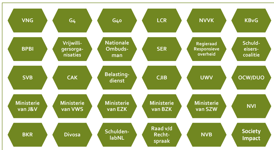
Figuur 2.2 Betrokken partijen in het Samenwerkingsverband Brede Schuldenaanpak

In dit samenwerkingsverband ontmoeten ministeries, gemeenten en andere soorten organisaties elkaar, waarbij zij elkaar informeren over verschillende initiatieven met betrekking tot de