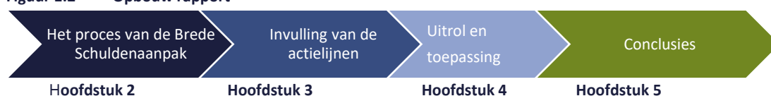
Figuur 1.2 Opbouw rapport

In de komende hoofdstukken worden de uitkomsten van deze evaluatie gepresenteerd. Hierbij is in hoofdstuk 2 allereerst aandacht voor het proces van de Brede Schuldenaanpak door te kijken naar de keuzes voor de verschillende actielijnen en thema's en hoe deze gewaardeerd worden door de verschillende soorten respondenten. Vervolgens komen ook de verschillende ervaringen met de invulling van het SBS aan bod. Hoofdstuk 3 focust zich in aansluiting daarop op (de ervaringen met) de invulling van deze actielijnen en de activiteiten en maatregelen per actielijn. In hoofdstuk 4 komen (ervaringen met) de toepassing en uitrol van de maatregelen bij gemeenten en uitvoeringsorganisaties aan bod. Ten slotte bevat hoofdstuk 5 de samenvattende conclusies.