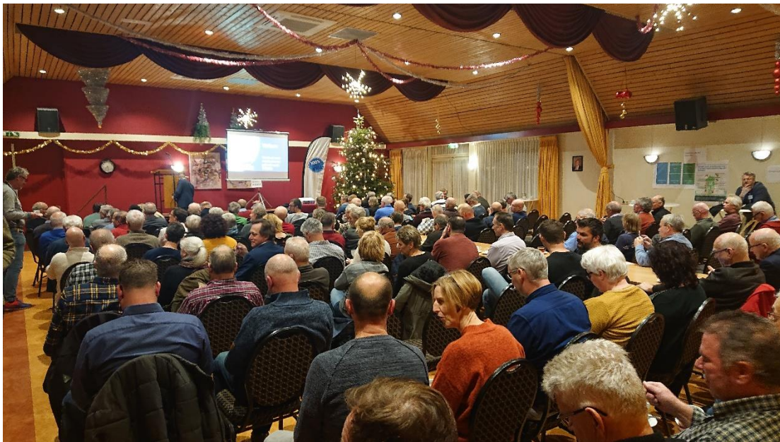
Angerlo Aardgasvrij Inwonersavond 20 december 2016