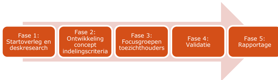
Figuur 3 Gefaseerde onderzoeksaanpak

In fase 1 van het onderzoek is na het startoverleg met de opdrachtgever deskresearch verricht naar broninformatie, zoals afkomstig uit jaarverslagen en jaarrekeningen van omroepen. Daarnaast is gekeken naar: