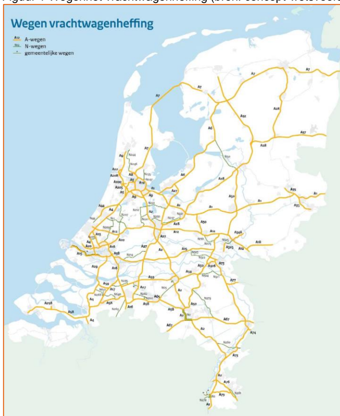
Figuur 1 Wegennet vrachtwagenheffing.

Tegenover de invoering van de heffing staat: