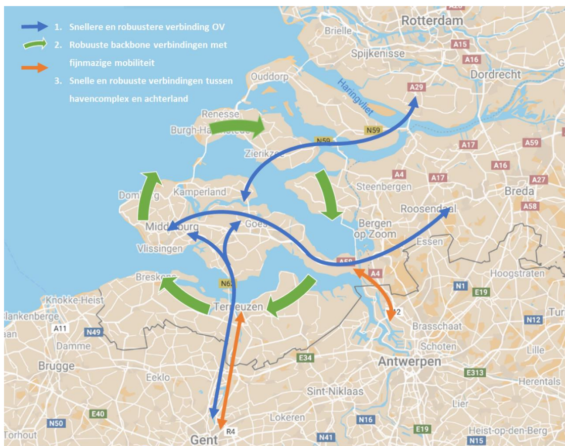
Figuur 3. Overzichtskaart actieagenda bereikbaarheid