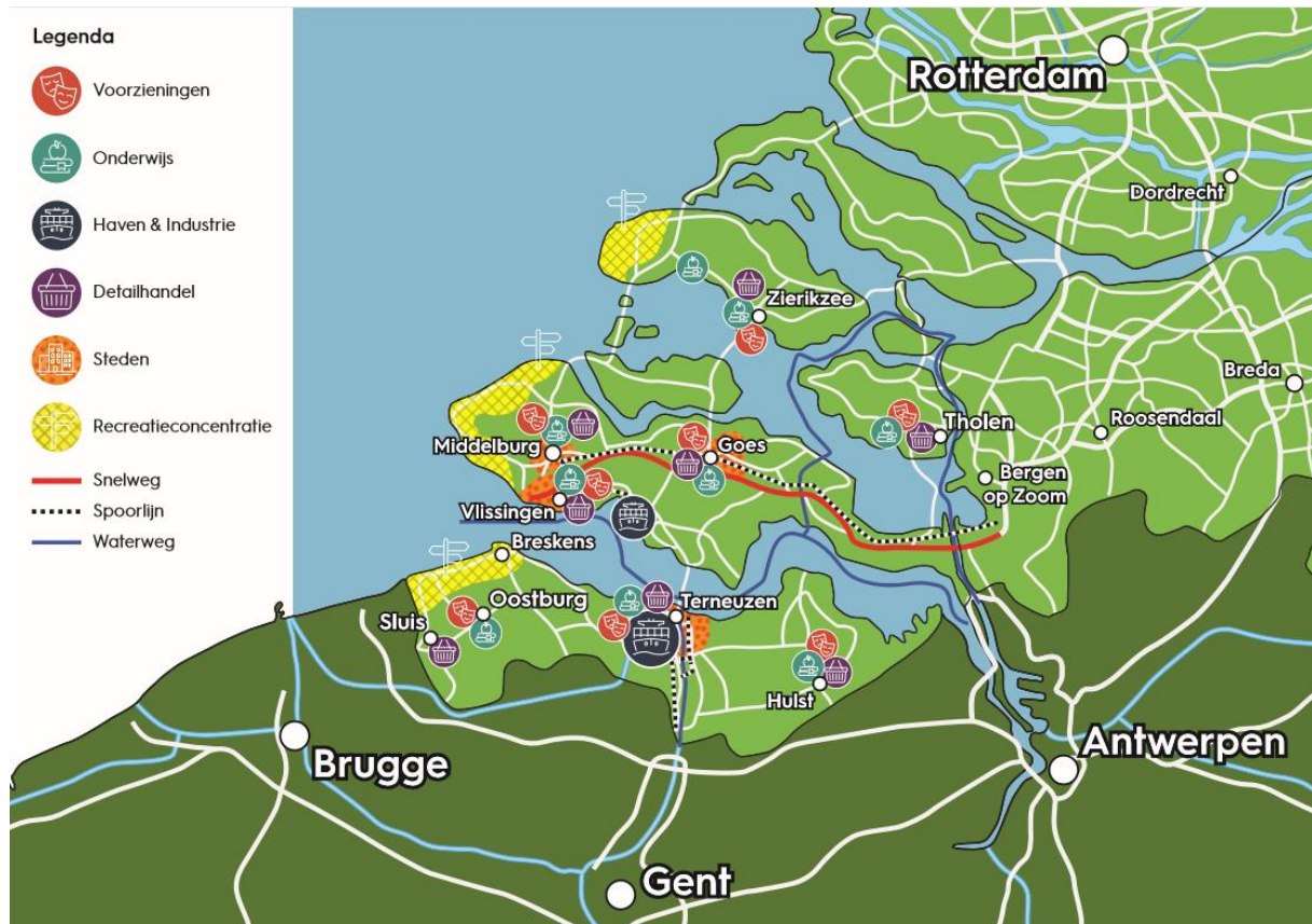
Figuur 1. Locatie kernen, voorzieningen, industrie, onderwijs en recreatie in Zeeland.

Figuur 1 laat in één oogopslag de locatie zien van huidige sociaaleconomische structuur, zoals kernen, voorzieningen, industrie, onderwijs en recreatie.