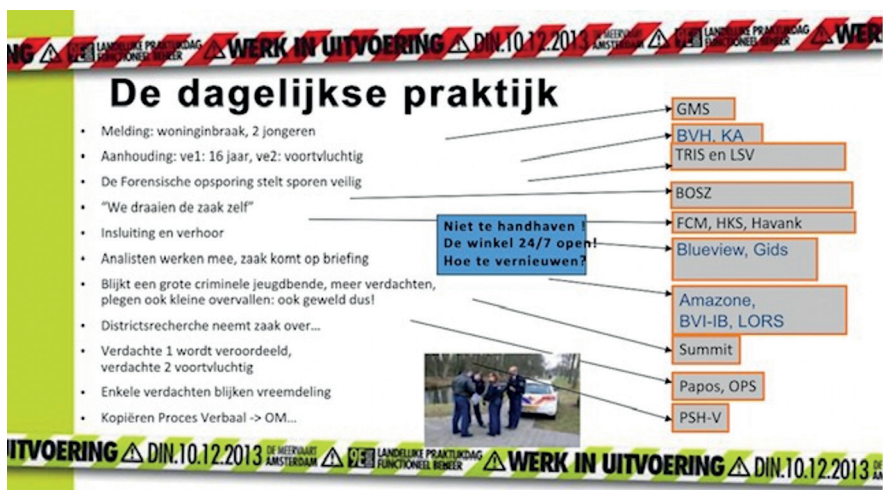
Figuur 1: Enkele systemen irt werkproces

Met betrekking tot rompslomp klaagt men veel over het gebrek aan koppelingen tussen de diverse technische en bedrijfsvoeringssystemen (BVH, Summ-IT, etc). Het duizelt velen van ons binnen de commissie nog van al de namen van die applicaties en hun onderlinge relaties.