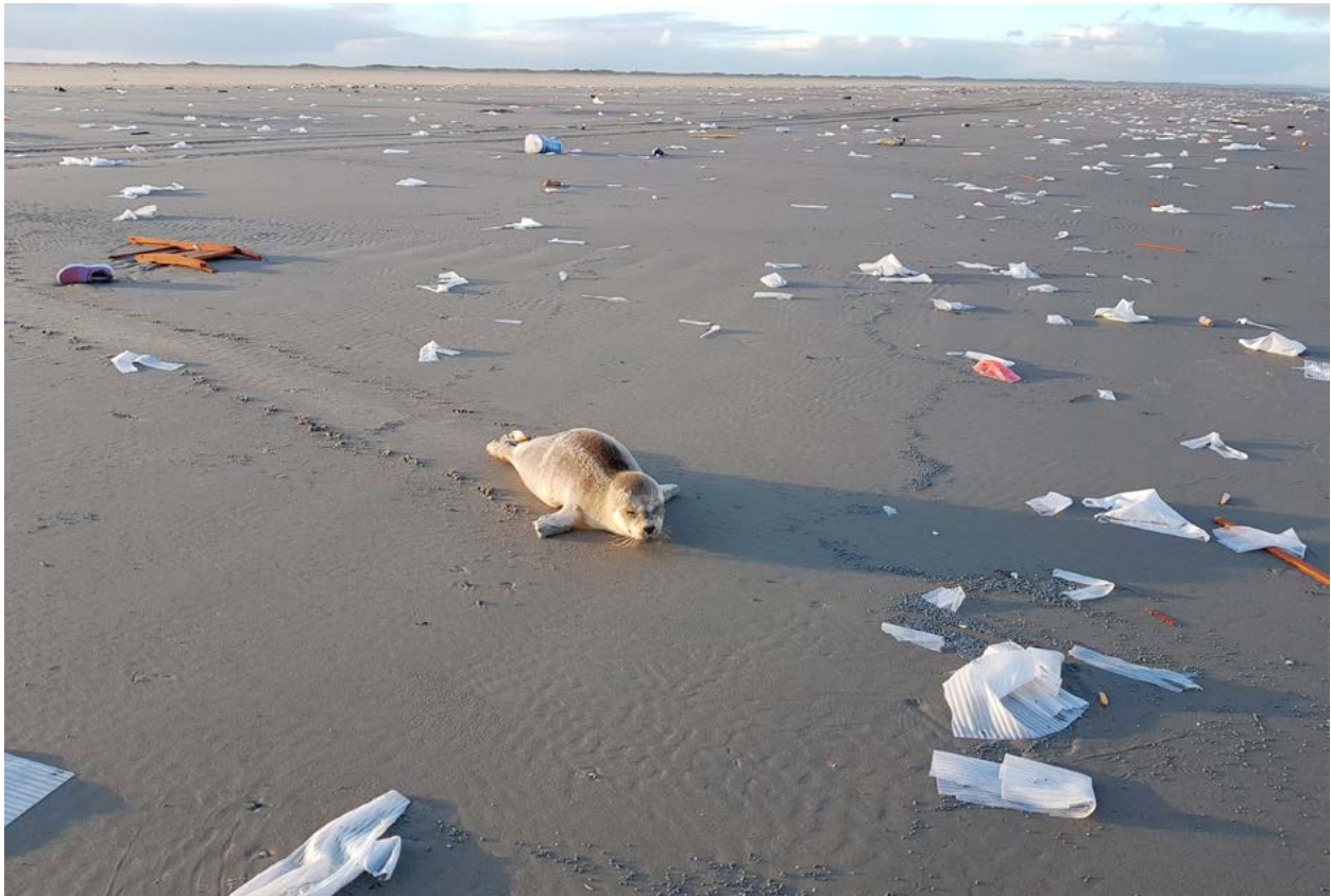
Jonge zeehond te midden van aangespoelde lading van de MSC Zoe op het strand van Balg (aan de oostkant van Schiermonnikoog) op 5 januari 2019 70 .

consortia. Elk consortium kan bestaan uit natuur- en sociale wetenschappers. Hoofdaanvragers zijn ervaren onderzoekers in dienst bij een Nederlandse universiteit en/of onderzoeksinstelling voor ten minste de looptijd van het project. Samenwerking met Duitse (eventueel Deense) partners, maar ook met vooraanstaande onderzoekers elders in de wereld, is daarbij een pré.