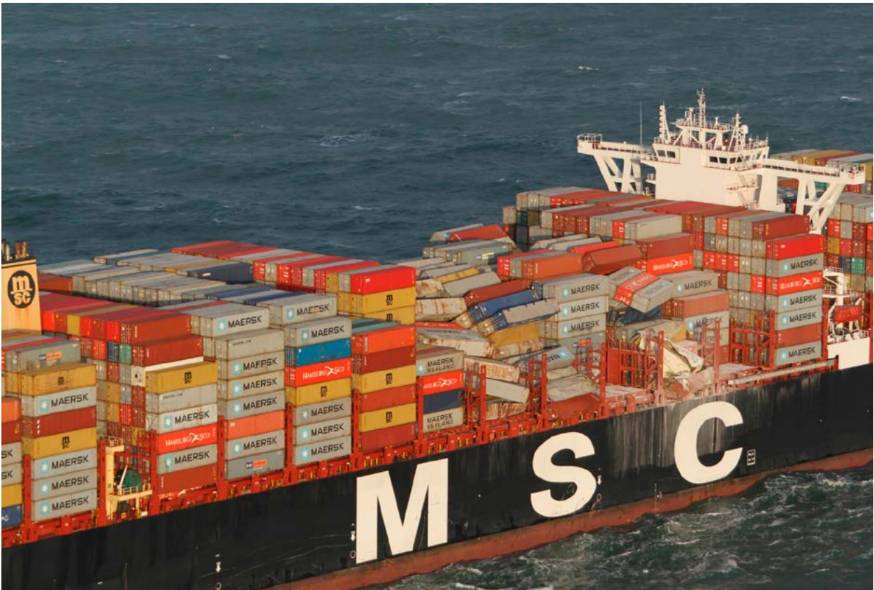
| Containers op de MSC Zoe 1 .