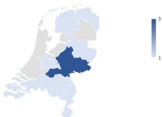
Figuur 2: Aantal convenanten per provincie