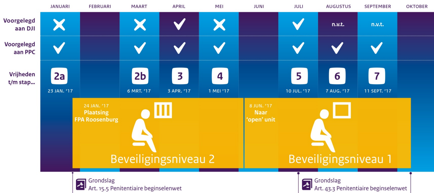
Figuur 3. Overzicht toegekende vrijheden aan P.

Uit figuur 3 valt af te lezen dat voor de vrijheden van P. het stappenplan wordt gevolgd. Duidelijk wordt dat DJI niet altijd is betrokken in de periode dat P. op grond van artikel 15 lid 5 Pbw in de FPA verblijft (zie ook paragraaf 7.5). Daarnaast wordt duidelijk dat P. op verzoek van FPA Roosenburg ongeveer maandelijks nieuwe vrijheden krijgt toegekend door PPC Vught en/of DJI.