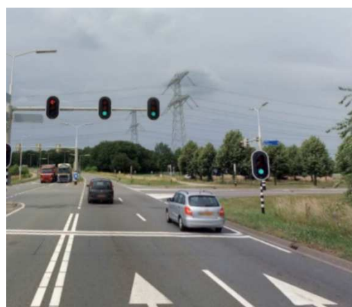
Figuur links kruispunt aansluiting A73, rechts kruispunt het Vonderen/Rijksweg.