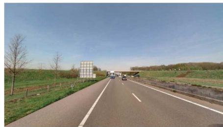
Figuur links wegbeeld het Vonderen / Rijksweg, links wegbeeld A73 in tegenrichting.