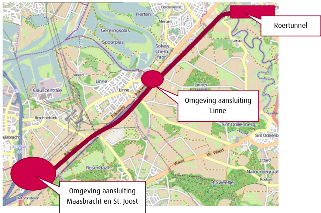
Figuur 2.1: Onderzoeksgebied.