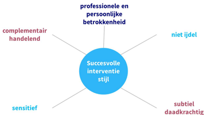
Figuur 3: 5 indicatoren van een succesvolle interventiestijl

Betrokkenen zijn het er over eens dat er in de periode 2014 – 2018 een programmabureau nodig was, dat intervenueert. Op het repertoire van interventiewijzen is geen kritiek, hoogstens is er op onderdelen verschil van mening (dit iets meer, dat wat minder). De breedte van dat repertoire wordt beschouwd als een kracht van het bureau. De kritiek op het bureau richt zich vooral op de stijl van werken van het bureau en de daarmee samenhangende positionering.