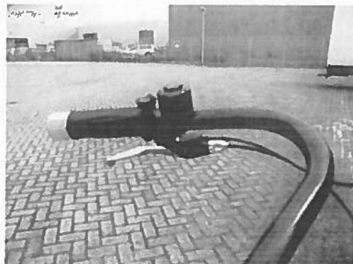
Afbeelding 3. De bel op het stuur

De Swing beschikt niet over richtingaanwijzers. Richting aangeven moet dus gebeuren door de hand uit te steken.