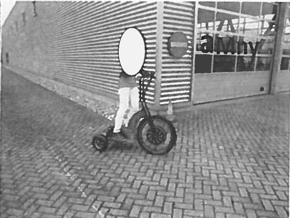
Afbeelding 1a en 1b. De Swing

Met de knijprem aan de rechterkant van het stuur remt men op het voorwiel en met de knijprem aan de linkerkant van het stuur remt men op de achterwielen. Gas (stroom) geeft men door met de duim op een handel te drukken aan de rechterkant van het stuur. De Swing heeft geen verlichting. Aan de achterzijde is een ronde rode reflector bevestigd (zie Afbeelding 2). Aan de linkerkant van het stuur is een bel bevestigd (zie Afbeelding 3). Het stuur is niet op hoogte instelbaar.