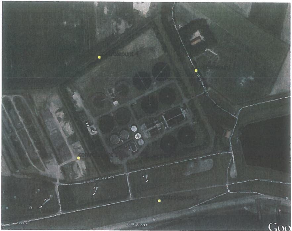
Figuur 1: controlepunten 1 t/m 4