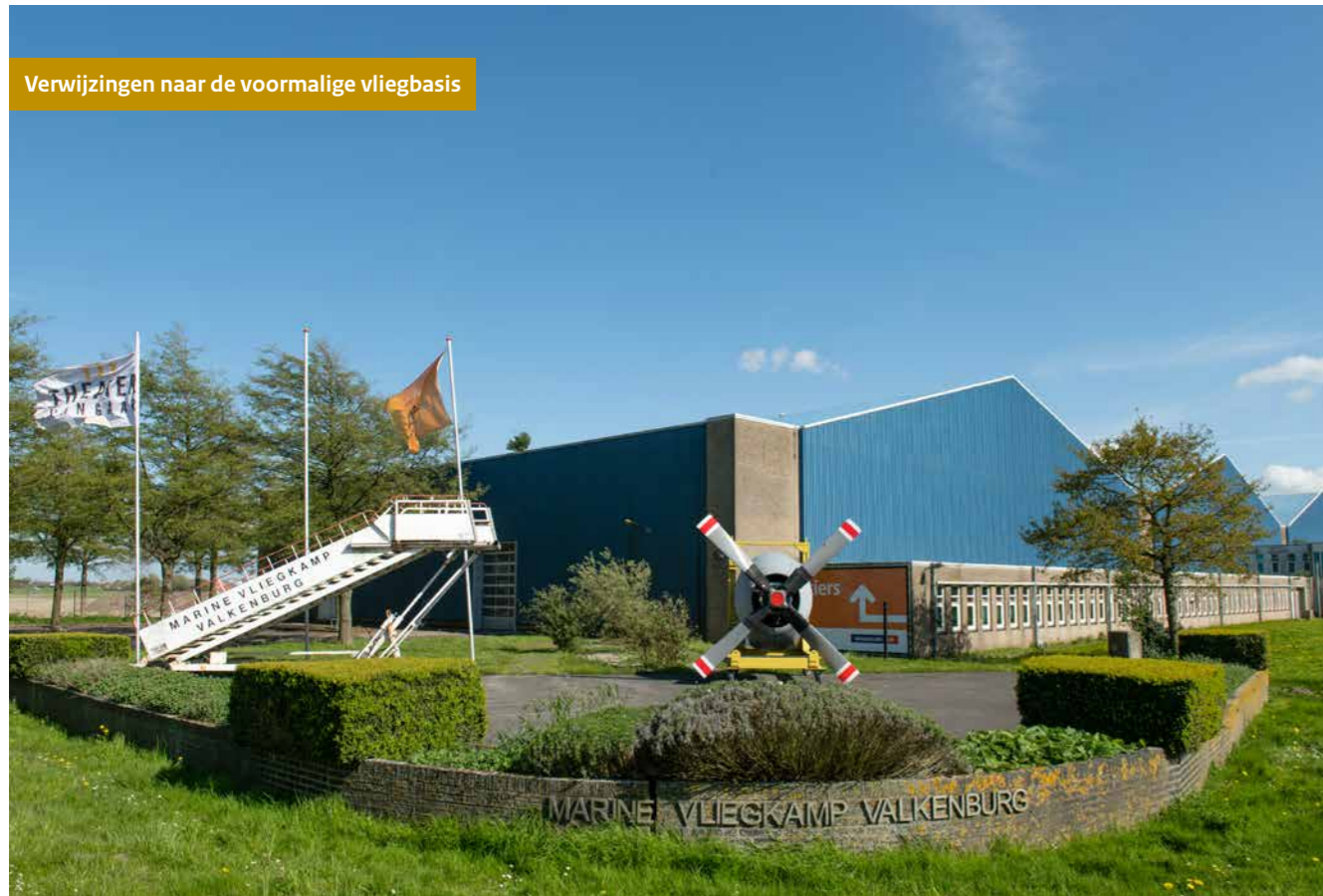
Verwijzingen naar de voormalige vliegbasis