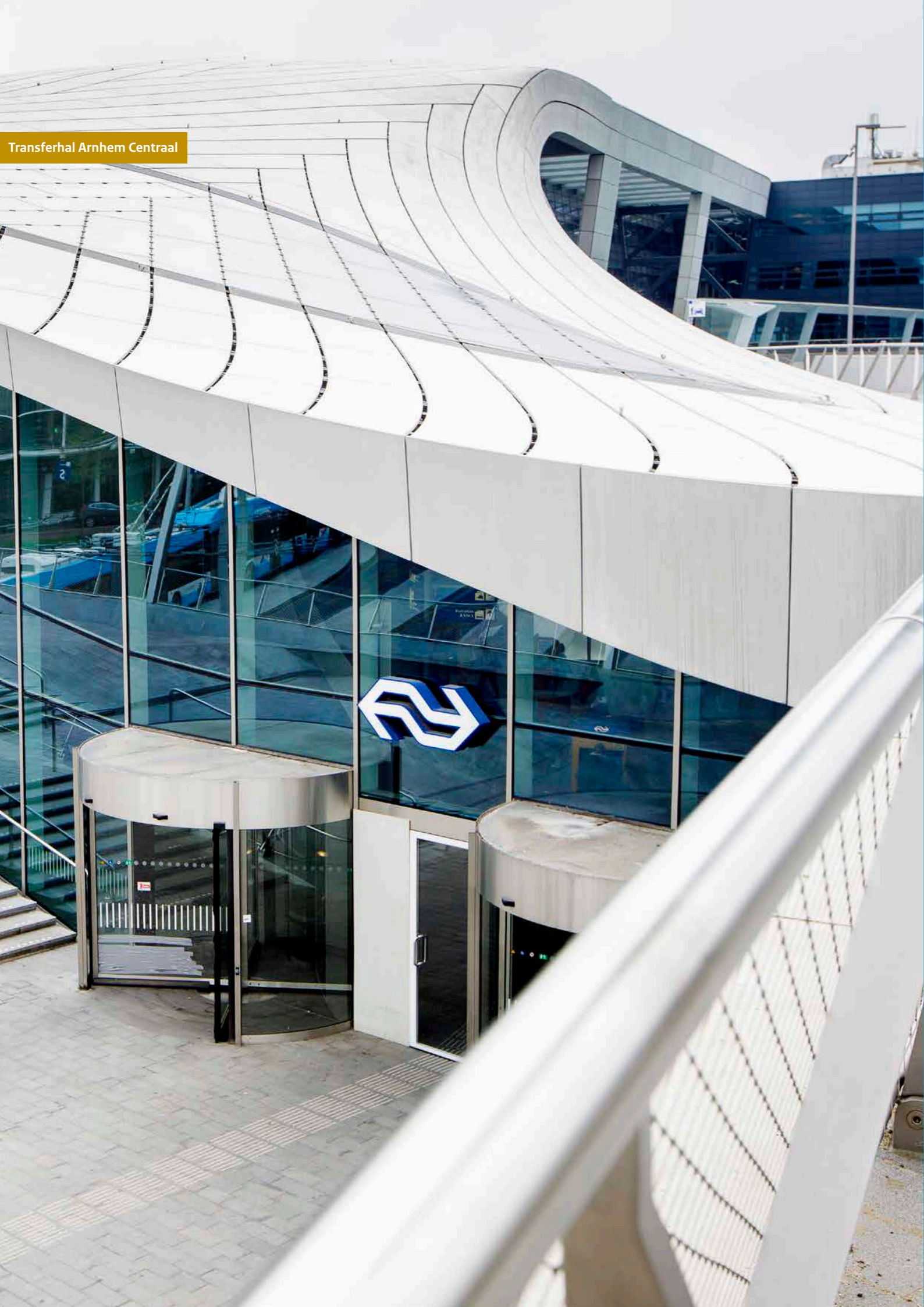
Transferhal Arnhem Centraal