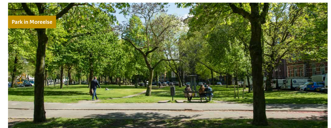
Park in Moreelse

Moreelse is een onbestemd gebied van sporen, kantoren en parkeren, maar ook van monumentale panden en bomen, een hofje en twee kleine parken. Veel (semi-) overheidspartijen als de rechtbank, Justitie, NVWA, ProRail en NS, zijn in het gebied gehuisvest. Zowel in rijksgebouwen als gehuurde onderkomens. Verzekeraar en vastgoedgelegger a.s.r. is er huisbaas van onder andere NS en ENECO heeft er een hulpstation. De school is eigendom van de gemeente.